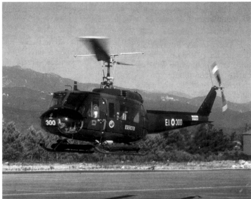
Hélicoptère terrestre Agusta-Bell AB 205.

Elles sont organisées en deux groupes pour remplir des mis-