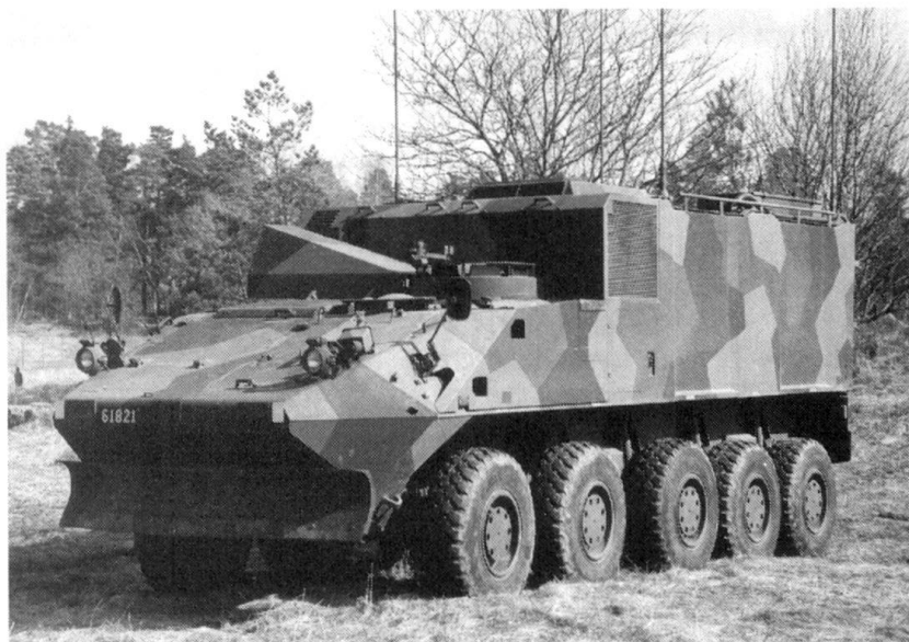
Véhicule de commandement développé à la demande de l'artillerie côtière suédoise. Un véhicule semblable équipera peut-être nos brigades blindées.

pour le LAV avec système de défense antiaérienne Blazer.