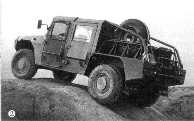
1. DURO: à la conquête du Moyen-Orient. 2. VAT: un véhicule tactique léger.