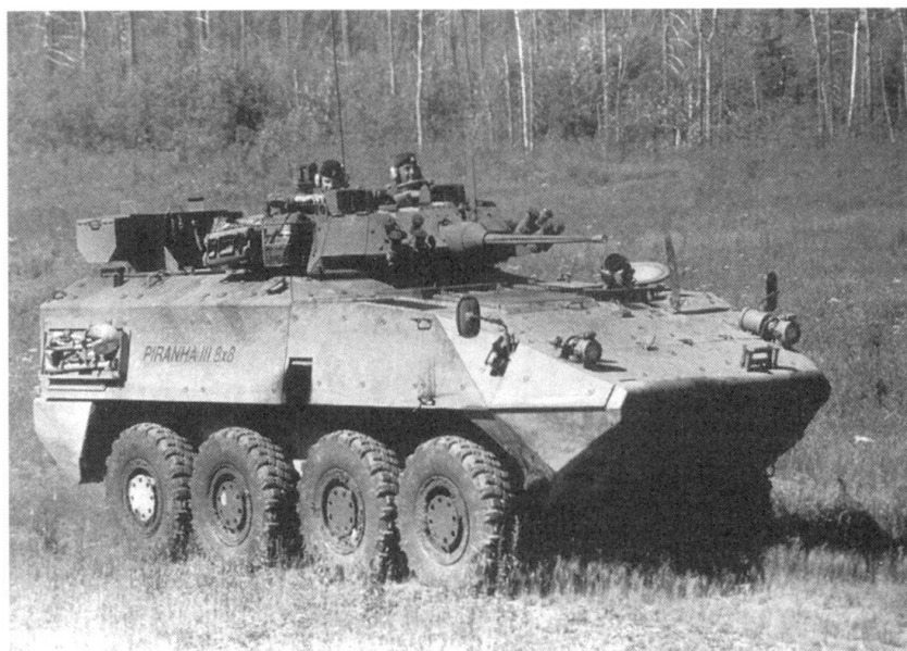
Le Piranha III 8x8, avec canon de 25 mm, lors des essais au Canada. 240 unités ont déjà été commandées; 411 autres devraient suivre.

Des études sont actuellement en cours pour équiper l'Eagle d'un mât rétractable avec caméras jour/nuit et télémètre; ce véhicule serait prioritairement destiné aux observateurs avancés de l'artillerie. Son volume intérieur permet l'intégration sans difficulté de l'électronique embarquée. Souhaitons que la climatisation soit aussi du programme car, en été, l'Eagle est un véritable four! Les essais devraient commencer l'an prochain.