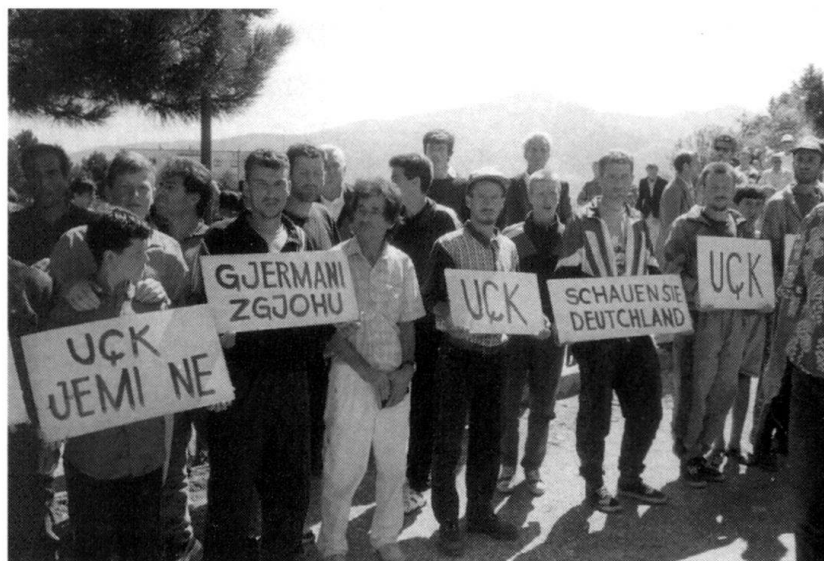
Manifestation de soutien à l'Armée de libération du Kosovo (ULK) lors de la visite du ministre des Affaires étrangères allemand, Klaus Kinkel, en Albanie au mois de juillet 1998.

– Nous allons conquérir notre liberté. Cela prendra encore du temps, mais nous y parviendrons. Il y a environ 92% d'Albanais qui vivent au Kosovo. C'est notre pays, et nous allons le récupérer et le libérer. Nous ne voulons rien d'autre que notre indépendance. Nous souhaitons que tous les Koso-