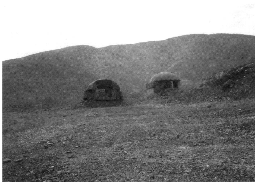
Paysage typique du nord de l’Albanie, avec des bunkers de l’époque de Enver Hodja placés à la frontière du Kosovo, où l’ALK a établi des campements.

RMS: Quelles furent tes expériences au sein de l’ALK?