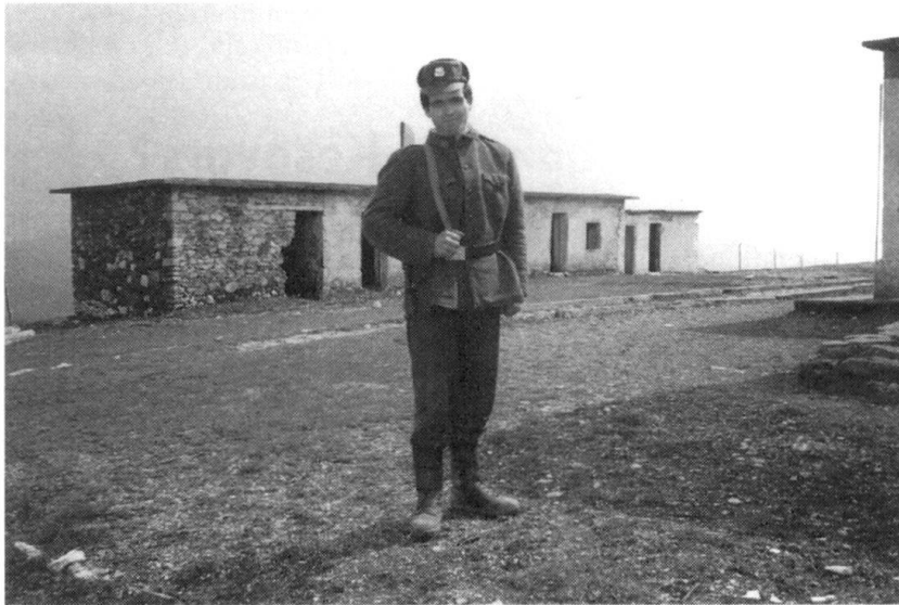
Douanier albanais gardant la frontière avec le Kosovo, vêtu d'un uniforme chinois...

RMS: Que sais-tu au sujet de volontaires russes qui seraient engagés dans l'armée yougoslave et qui combattraient par idéalisme, sans être payés?