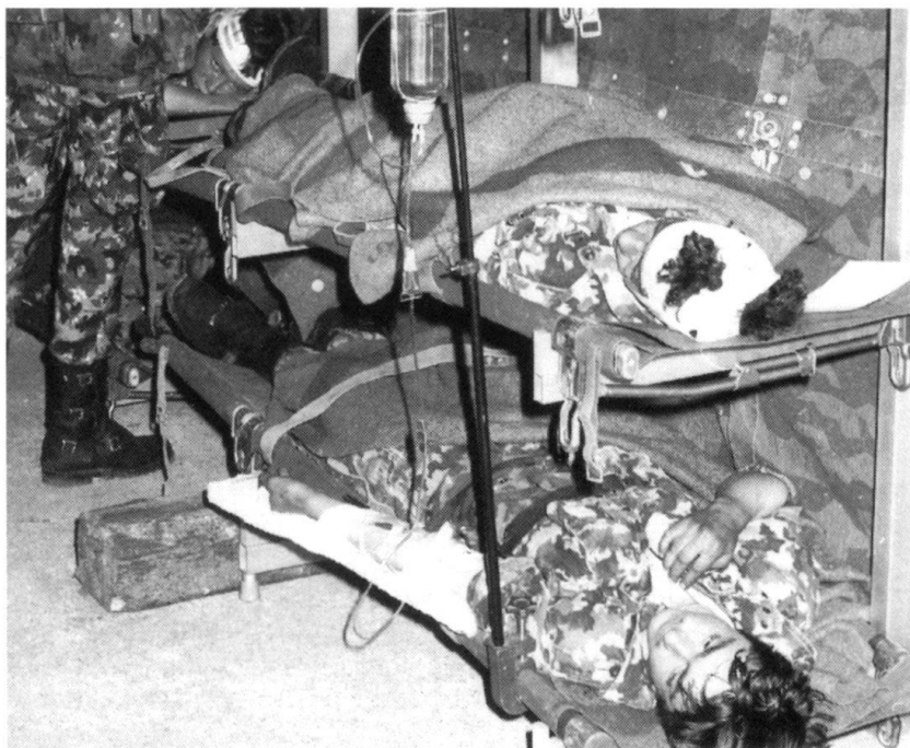
Pas de morts et le moins possible de blessés!