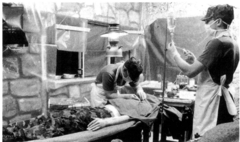
...pourtant, les militaires doivent savoir travailler dans des conditions rustiques!

Il est souhaitable qu'un instrument performant de suivi et gestion des carrières des cadres de milice soit mis en place. Cet instrument devrait aussi être établi à l'échelon de l'armée, de manière à permettre une vue d'ensemble. La difficulté est de combiner les processus de sélection qui se déroulent encore au niveau des Grandes Unités et les intérêts supérieurs de l'armée dans son ensemble. Il est en effet possible qu'aucune fonction appropriée ne soit disponible pour un milicien dans sa Grande Unité d'incorporation, mais que ses aptitudes particulières puissent être utilisées ailleurs. En d'autres ter-