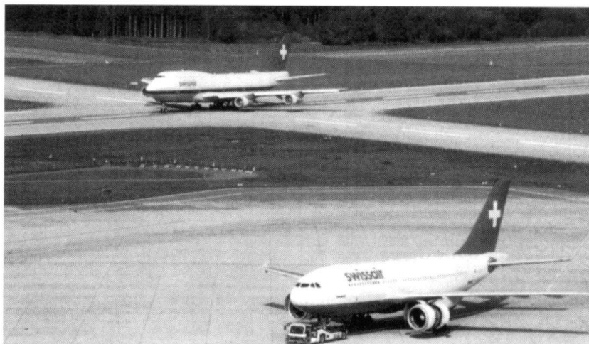
La formation militaire de beaucoup de ses pilotes est utile à Swissair; celle acquise chez Swissair est utile à un pilote militaire de milice...

En raison de la durée très courte des différentes écoles de formation de l'armée, de telles qualités ne sont que peu enseignées ou développées. Elles font partie du bagage que l'on attend du milicien, bagage qui s'est constitué par sa formation et son expérience professionnelles. En particulier, on attend de lui qu'il soit habitué à faire face à des situations de stress réelles et à la prise de décisions ayant des conséquences concrètes. A l'échelon de la tactique et de la conduite du combat et jusqu'à la conduite des opérations, les cadres de l'armée sont durant leurs services militaires confrontés à des situations virtuelles et prennent des décisions dont les conséquences ne sont pas vérifiables. Il est d'ailleurs symptomatique de constater que la plupart, si ce n'est la totalité des exercices, se finissent de manière favorable.