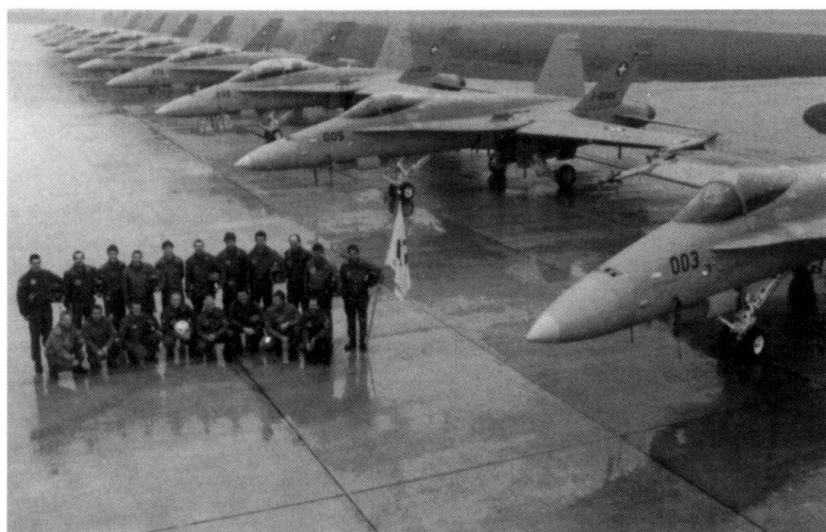
...est-ce encore possible avec le F/A-18?

Une possibilité encore peu utilisée d'accroître l'attrait de la formation militaire serait d'inclure les cadres de milice dans les programmes de formation à l'étranger. Pour l'instant, la fréquentation de cours dans les académies de défense d'autres pays, de même que la participation à des séminaires, cours ou exercices proposés, notamment dans le cadre du Partenariat pour la paix (PfP), demeure trop souvent un privilège réservé aux instructeurs ou aux fonctionnaires de l'administration fédérale.