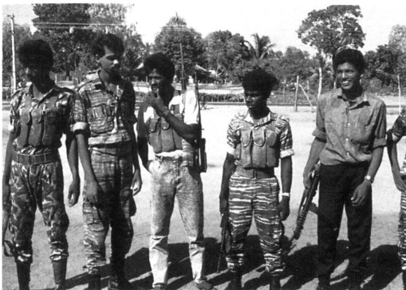
Une unité de combat du LTTE.

bombe éclate en pleine capitale de Colombo ou lorsque des Tamouls immigrés en Occident manifestent pour leurs droits. Pourtant, dans le nord et l'est de cette île de l'océan Indien, dont le territoire équivaut à une fois et demie la superficie de la Suisse, des combats ont lieu entre Tamouls et les forces gouvernementales qui ont établi une tête de pont sur l'île au sud de Jaffna. Ces succès n'ont pas fait renoncer un LTTE qui est retranché dans une zone de jungle et qui continue à disposer d'un territoire et d'une population. Ces deux éléments sur lesquels il peut s'appuyer sont déterminant dans une stratégie de guérilla.