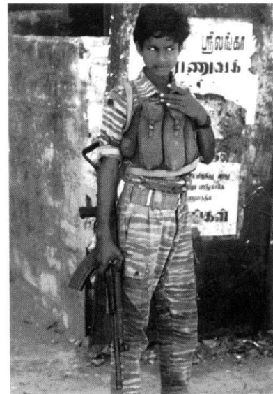
Ce jeune Tigre du LTTE, représente le combattant actuel du mouvement tamoul: jeune, discipliné et prêt à combattre jusqu'à la mort.

C'est dans les années 70 que les troubles commencèrent à éclater dans le nord du pays et notamment sur la péninsule de Jaffna qui est historiquement le bastion tamoul de l'île. En 1972, Vellupilai Prabhakaran, âgé à l'époque de 18 ans, qui est aujourd'hui le leader du