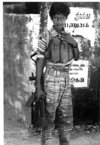
Ce jeune Tigre du LTTE, représente le combattant actuel du mouvement tamoul: jeune, discipliné et prêt à combattre jusqu'à la mort.

C'est dans les années 70 que les troubles commencèrent à éclater dans le nord du pays et notamment sur la péninsule de Jaffna qui est historiquement le bastion tamoul de l'île. En 1972, Vellupilai Prabhakaran, âgé à l'époque de 18 ans, qui est aujourd'hui le leader du