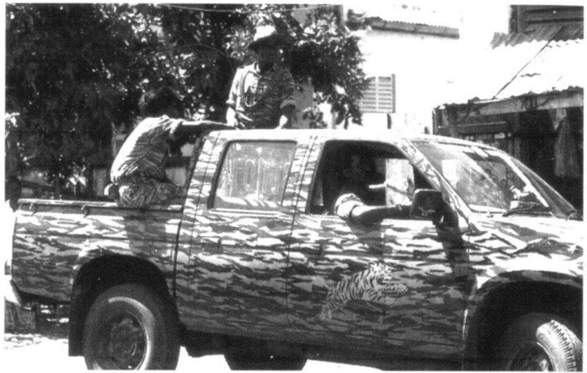
Le LTTE s'appuie sur les communautés tamoules installées dans le monde pour lever son impôt révolutionnaire et ainsi subventionner la guerre qu'il mène contre le gouvernement de Colombo.

Le LTTE fait une utilisation répétée et intelligente du lance-