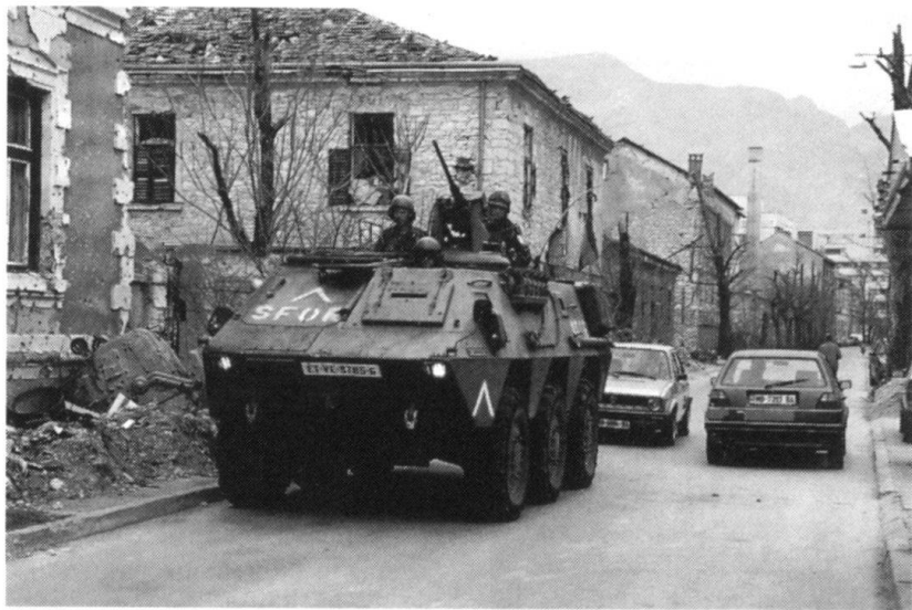
La Bosnie, à l'ouest d'une «zone de tempête» qui s'étend jusqu'en Chine...

Aux portes de l'Europe occidentale opèrent des milices, des guérillas mutantes, entités hybrides formées de terroristes, de «bandits patriotes» et de militaires déserteurs, commandées par des généraux dissidents, des «seigneurs de la guerre» ou de purs et simples bandits. Ces gens ignorent superbement les lois internationales, spécialement celles qui relèvent du respect de l'humain. Un continuum sans précédent guérilla – narco-traffic – terrorisme – mafia s'est désormais constitué.