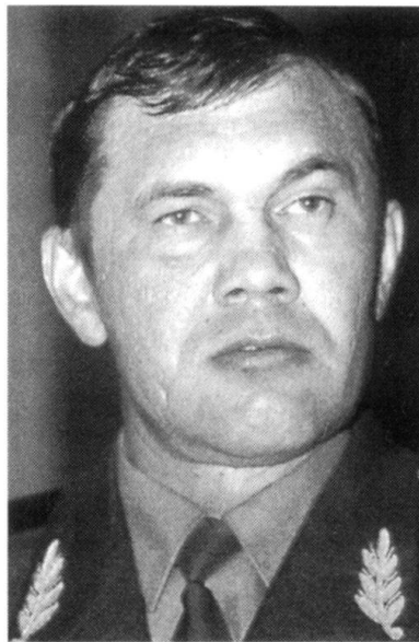
Le général Lebed serait-il ce leader à poigne, capable de remettre de l'ordre en Russie et de redonner la fierté à ses habi-

En Occident, les dangers les plus graves actuellement n'ont plus rien à voir avec ceux de la guerre froide ou du terrorisme classique. Trafic de stupéfiants, de substances nucléaires, d'individus, de composants électroniques sensibles, d'armes, fanatismes religieux, ethniques et tribaux, guerres civiles, famines, piraterie, voilà quelques-unes des menaces à la paix et à la sécurité internationale. Dans un tel contexte, les conceptions de défense nationale et de sécurité intérieure doivent s'adapter. Il faut mener le combat contre