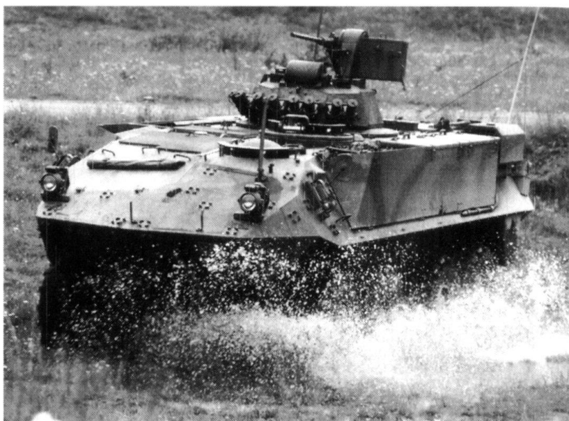
Char de grenadiers Piranha 8 x 8.

ELTAM permet d'exercer librement le combat de deux formations mécanisées adverses, des bataillons de chars ou des parties de ces derniers, sur un terrain généré par ordinateur d'une surface de 90 km carrés. Les exercices ne sont pas prédéterminés de manière rigide; ils évoluent en fonction du comportement des deux formations exercées. Le simulateur permet de représenter au maximum 400 «objets» en interaction, par exemple des chars, des sections, des éléments d'exploration.