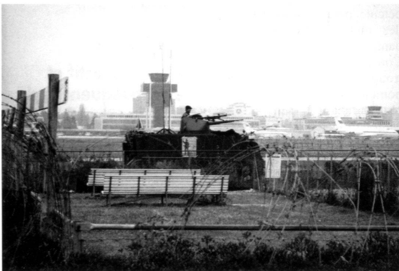
La troupe de garde à l'aéroport de Cointrin.

Suite à ces tragiques événements s'ouvre une troisième période, au début de laquelle un certain nombre de leçons sont tirées par les autorités fédérales et surtout les militaires. Celles-ci cherchent tout d'abord à responsabiliser les cantons et à les laisser se débrouiller seuls, mais les événements ayant pris une dimension nationale, il est décidé de renforcer la préparation militaire, afin de pouvoir réagir avec rapidité et efficacité le cas échéant. C'est ainsi que l'Etat-major général met au point un