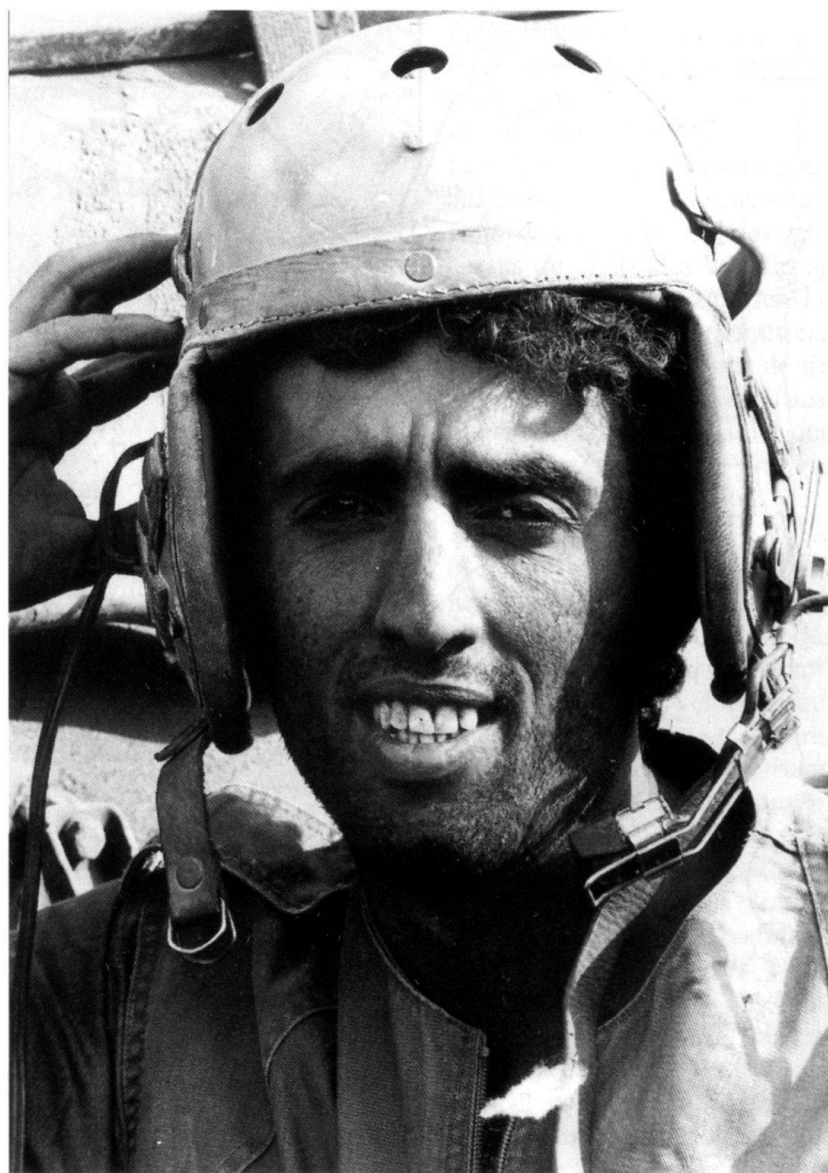
L'épuisement, la douleur et le stress se lisent sur le visage de ce pilote de char du 77 e bataillon.

par eux. En ces temps «préhistoriques» d'avant la guerre du Golfe, avant que des systèmes d'acquisition de but par laser ne fassent de la recherche d'un but un acte guère plus compliqué qu'un jeu vidéo, un adversaire que l'on a manqué découvrir la position du char qui vient de tirer et peut riposter. Si l'on est chanceux, on peut l'atteindre au deuxième coup, avant qu'il ne puisse ouvrir le