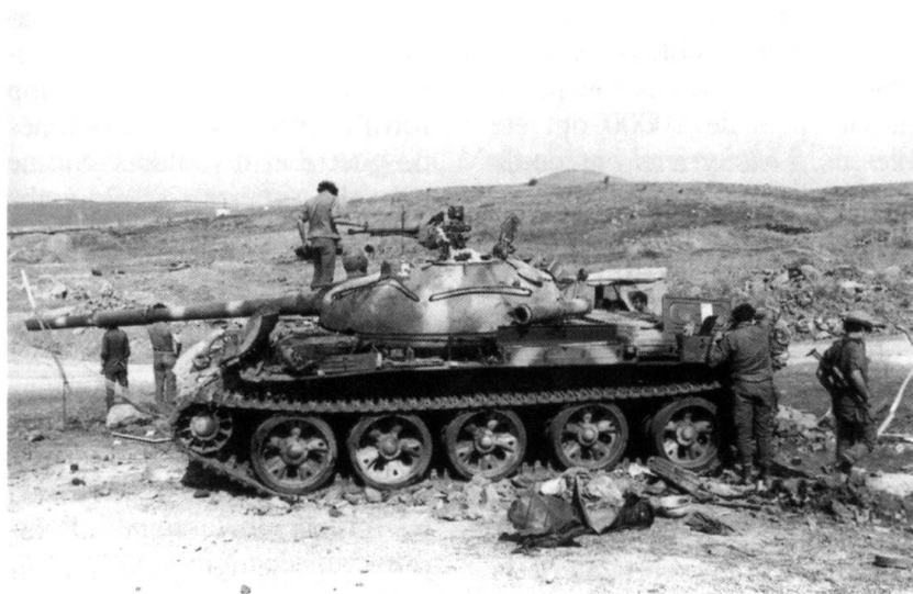
Près de Tel Hermonit.

Kibbutzniks de Galilée, se battent pour leurs foyers, mais aussi contre les effets démoralisants de la fatigue, de la faim, de la peur, de la douleur et de l'anxiété.