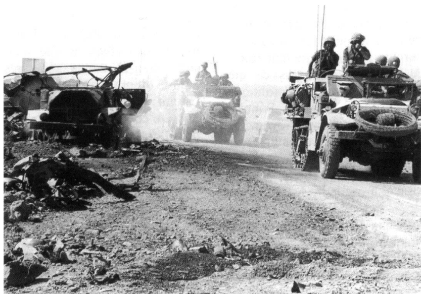
Des renforts montent en ligne et traversent le champ de bataille près de Booster.

Traduction: Vania Burgeat. Adaptation: Rédaction RMS.