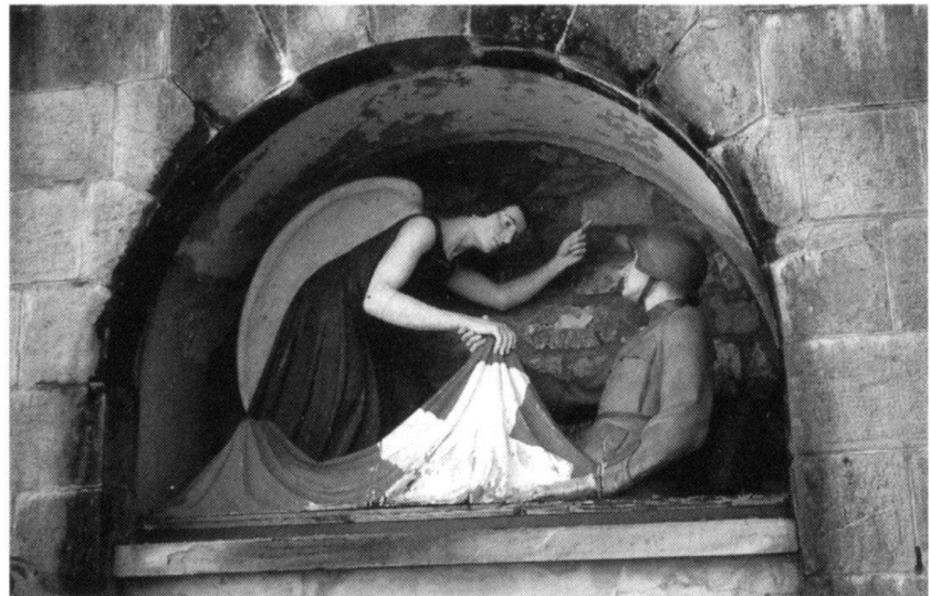
Châtel-Saint-Denis, «Aux soldats de la Veveyse morts pour la Patrie, 1914-1918, R.I.P.». »

consacrée en France ou dans les pays anglo-saxons. Il y a là une lacune à combler et il est temps que le monde académique – mais pas seulement lui – s'y intéresse : n'a-t-on pas vu, il y a quelques années, un étudiant genevois se pencher sur les monuments... d'une région française voisine 2 ?