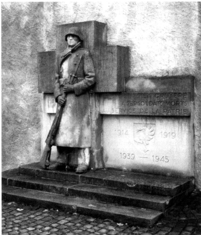
Bulle, «La Gruyère à ses soldats morts au service de la Patrie, 1914-1919, 1939-1945».