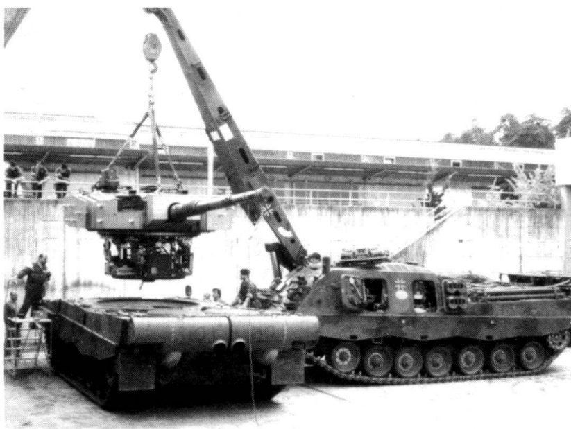
Le Büffel soulevant la tourelle du Leo Kawest suisse.

Les essais menés depuis une dizaine d'années en Suisse et à l'étranger montrent que l'installation d'un kit de déminage (chaînes, rouleaux et charrue) sur un char de combat est peu efficace: le poids supplémentaire, à l'avant, a tendance à faire plonger l'engin tout entier. Le déminage est pratique-