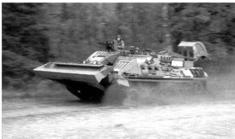
Le char du génie de Moelv/Hägglunds sur châssis Leopard 1.

D'autres projets sont également à l'étude, comme l'adaptation sur le châssis Leopard 2 du système d' Engin principal du génie (EPG) français de Giat Industries. Ce système modulable permet à un véhicule, grâce à une grue hydraulique, de se configurer en