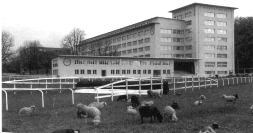
Vue générale du bâtiment datant des années 1930.

L'entreprise CIAL doit être crédible et s'orienter vers ce qui est nécessaire et pas seulement vers ce qui est faisable dans les circonstances actuelles. Cette situation n'est pas toujours confortable. Au Centre d'instruction de l'armée, nous nous efforçons de concevoir activement la pointe du progrès. Nous avons un rôle de pionniers à jouer, et nous devons préparer nos cadres aux missions futures sans négliger,