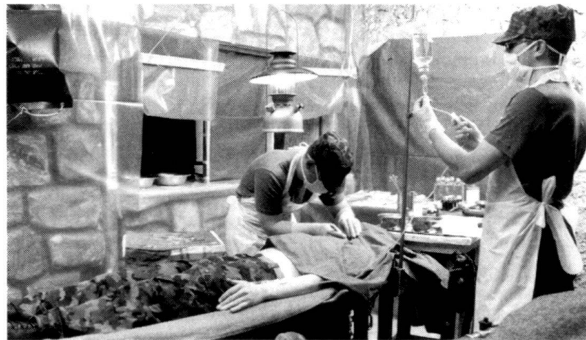
...Pourtant, les militaires doivent savoir travailler dans des conditions rustiques!

Sans une économie publique performante, la logistique de l'armée et, par conséquent, l'armée dans son ensemble ne peuvent pas remplir leur mission à long terme. C'est pourquoi le facteur principal pour mener à bien les opérations grâce à la logistique est constitué par le potentiel industriel d'une part, de la technologie disponible et de la capacité à maîtriser cette technologie d'autre part. La santé publique civile représente la même importance pour le service sanitaire.