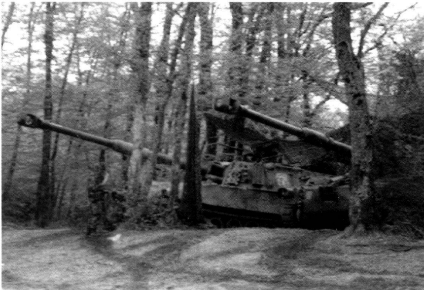
M-109 en position d'aguet au Camp romain...

zerfaust, simulateurs de tir et de conduite.