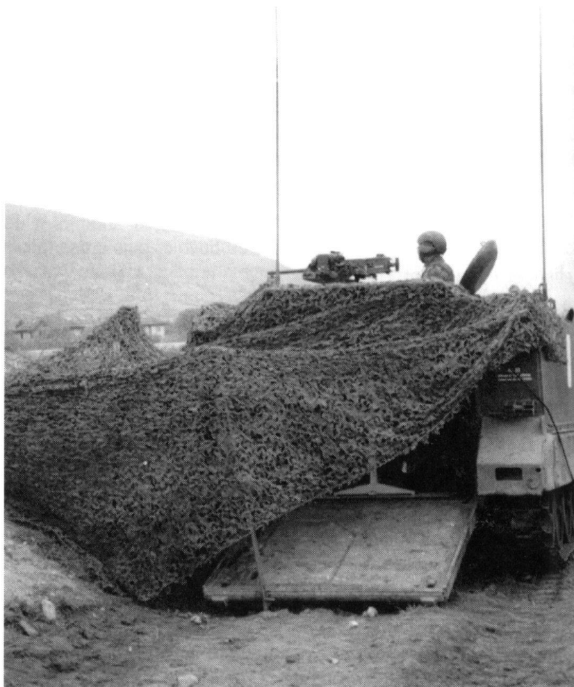
... Véhicule camouflé du commandant de tir.

L'extension de l'infrastructure ne s'arrête pas là! Les bâtiments d'instruction des écoles d'officiers d'artillerie, avec la halle à usages multiples, en sont la preuve. Depuis 1996, la place d'armes accueille encore le commandement des opérations pour le maintien de la paix (Bérets bleus et jaunes) ainsi que le commandement des écoles et cours de l'infanterie mécanisée, qui remplace l'infanterie motorisée et bénéficie des crédits nécessaires aux adaptations de l'infrastructure. Pour les formations de maintien de la paix, il faut pour l'instant improviser. Un vaste programme de rénovation des casernes et des halles amène, à côté d'un confort supplémentaire, de la couleur sur la place. Dès 1997, la gare militaire du BAM permet l'acheminement des obusiers blindés, chars, véhicules, munitions et matériel directement sur la place d'armes; une route de contournement évite le village de Bière. En 1998, l'arsenal et le PAA