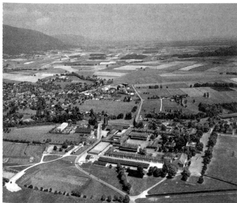
Place d'armes de Bière à vol d'oiseau.

Malgré de sérieuses lacunes dans l'approche globale de l'occupation et de l'extension, le climat de travail sur la place d'armes de Bière est sain, empreint de compréhension réciproque et d'esprit de compromis à tous les niveaux. Il s'agit de ne pas abuser, car c'est justement de telles situations qui risquent d'«exploser», brusquement et sans raison apparente, échappant à tout contrôle. Il ne faut pourtant pas oublier les points positifs :