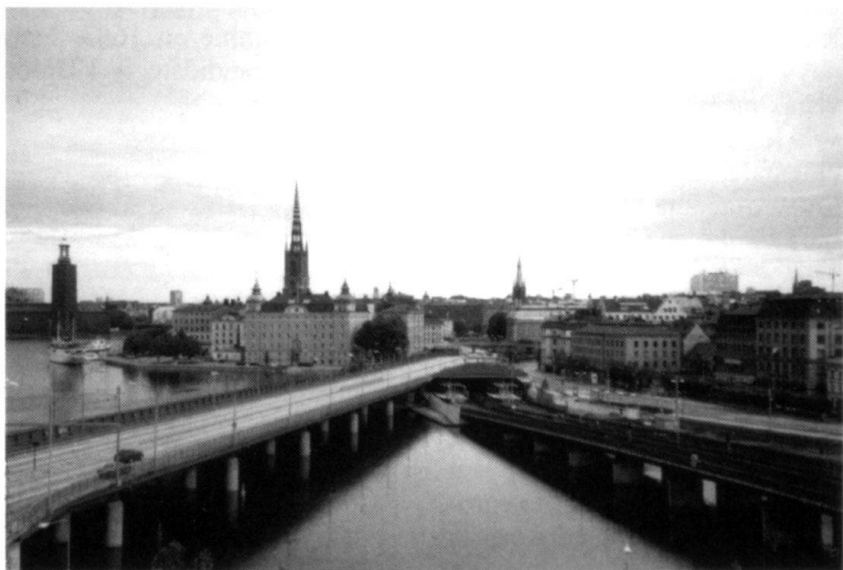
Des Etats socialement avancés comme la Suède n'ont pas avantage à s'aligner sur les normes européennes. Ici une vue de Stockholm, la ville qui vit en symbiose avec la mer...

Toutefois, il y a un autre prix à payer, beaucoup plus lourd de conséquences. Les Etats-Unis ne voient plus l'Europe comme une sonnette d'alarme face à un éventuel agresseur soviétique. C'est pratiquement son plus grand compétiteur économique, donc virtuellement un adversaire. L'intérêt américain commande de rabaisser ce compétiteur. Comment trans-