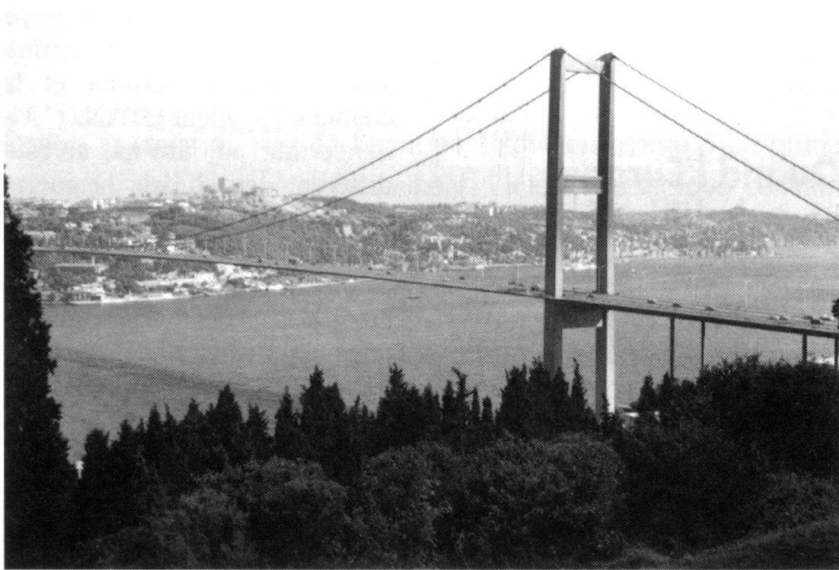
La Turquie sera-t-elle admise dans l'Union européenne? Ses 66 millions d'habitants en font un Etat aussi peuplé que la France. Dans cinquante ans, la Turquie pourrait avoir 100 millions d'habitants... Ici le pont, près d'Istanbul, qui unit l'Europe à l'Asie.

former l'Europe en un marché ouvert de 370 millions de consommateurs et la faire sortir de la technicité? L'élargissement est un moyen, car les pays les plus riches de l'Union européenne en perdraient la direction politique et épuiserait leurs ressources à intégrer des pays plus pauvres. Les nouveaux membres se verraient ouvrir les portes de l'Europe occidentale, avec une immigration d'autant plus massive qu'incontrôlée.