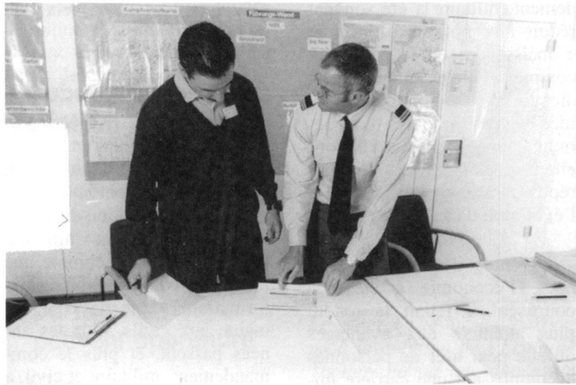
La conduite, militaire et civile, est fonction de la personnalité du chef...

Selon les principes d'apprentissage et d'instruction des cadres supérieurs de notre armée de milice, l'accent est mis sur les champs de compétence technique et méthodologique ; la compétence sociale, par exemple, est présumée ou couverte par le système de sélection des cadres. Cet état de fait est dû à la brièveté des périodes de service militaire que connaît notre armée de milice,