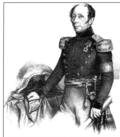
Le général Dufour, qui participa à la création de l'Ecole de Thoune, donna une dimension moderne à la formation des chefs militaires.