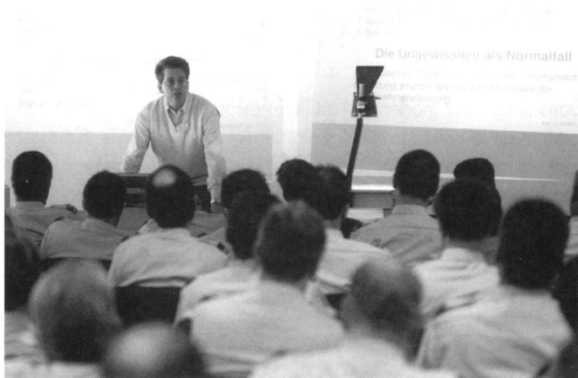
Pendant un cours «TRANSFERT PLUS».

«TRANSFER PLUS» est un stage de formation spécial à l'attention des cadres moyens ayant des fonction de direction, organisé conjointement avec un stage de formation au commandement. L'idée de ce cours est de transmettre aux civils intéressés les caractéristiques