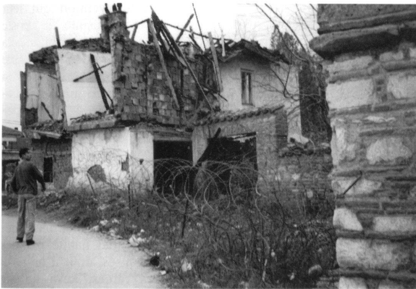
Prizren: l'incendie intentionnel, un moyen d'épuration ethnique.

ce que ceux-ci ont refusé un élargissement de la «zone de confiance» au nord de la rivière et qu'il n'y a aucun progrès dans la région à cause de l'extrémisme dans les communautés dominantes.