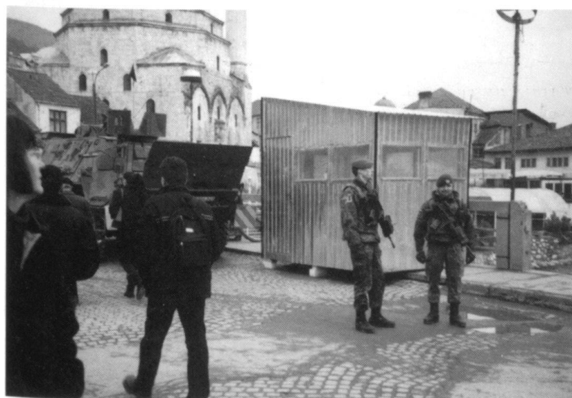
Prizren: un poste de contrôle allemand sur un pont.

mois au Kosovo, les cadres et les soldats français font des relèves de quatre mois, sauf les officiers qui servent dans des états-majors de la KFOR (six mois). Pour les préparer, il faut un mois d'instruction, également un mois pour la remise en condition après le retour au pays. Cette solution donne du temps pour faire de l'instruction de base pour assurer l'engagement primaire des for-