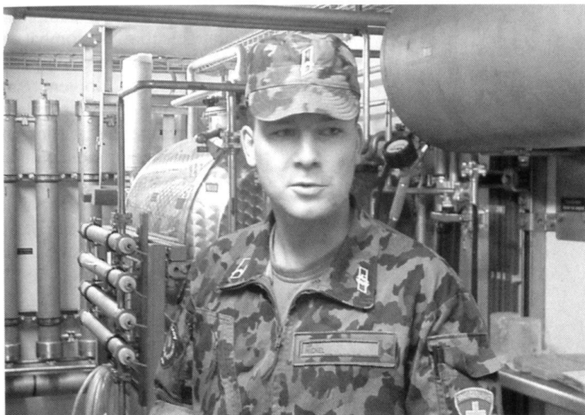
Installation de purification d'eau de la SWISSCOY.

Le recrutement de volontaires s'effectue par voie d'annonces dans les journaux et sur la base d'un pool actuellement de 3500 hommes et femmes qui se sont inscrits. 350 d'entre eux se font convoquer à une journée d'information. Une partie d'entre eux feront le cours d'instruction à Bière. Les membres de la SWISSCOY ont un contrat civil avec la Division pour les opérations en faveur du maintien de la paix (Bière). Le salaire, fonction de la formation civile, de la charge de famille et du grade, n'est pas identique pour chacun, mais il est, pour la majorité