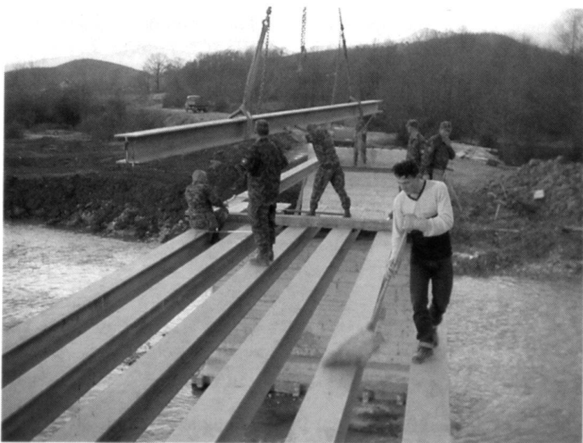
Montage du pont de Rosulje, près de Pec.

dans le terrain (les démineurs ne travaillent pas sans une «présence médicale»). Dans la cuisine du camp, une douzaine de personnes préparent chaque jour quelque 1600 repas chauds. La cuisine est équipée pour préparer et servir 2400 repas chauds par jour. Les réserves permettent de nourrir les