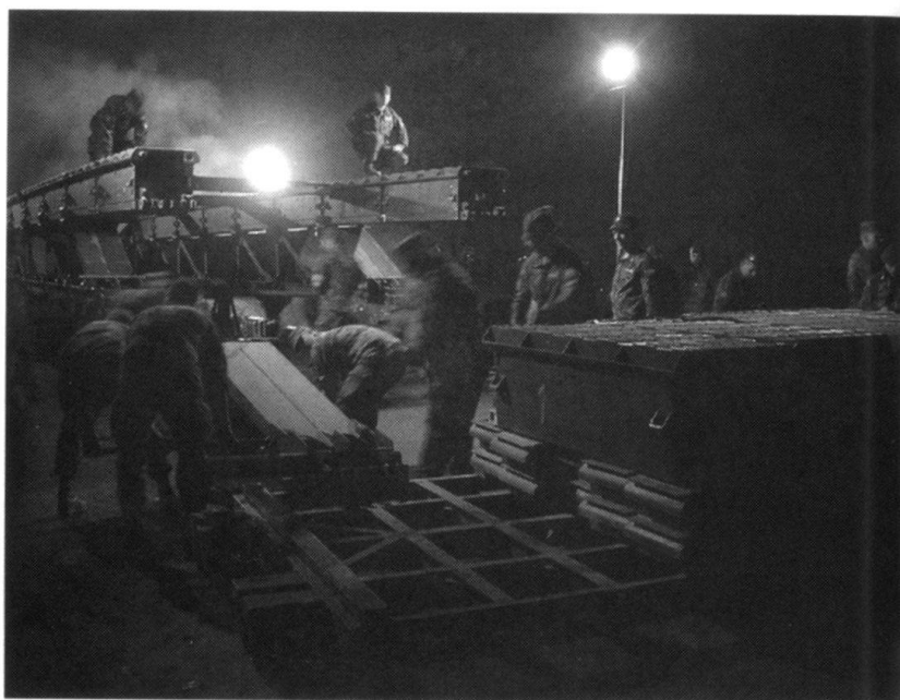
Montage du pont à Dubovo.

L'équipe médicale de quatre personnes, qui travaille très activement avec le personnel de l'infirmerie du bataillon autrichien, remplit une importante mission spécifique: accompagner les équipes de déminage