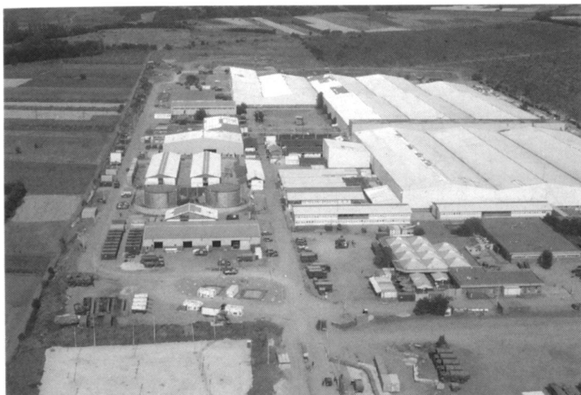
Vue aérienne du site de « Casablanca ».

nir une aide d'urgence au Kosovo et une contribution à la stabilisation de la région.