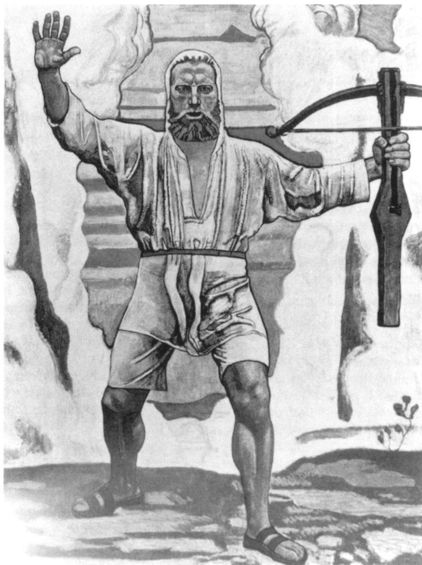
A la fin des années 1930, le Guillaume Tell peint par Ferdinand Hodler ne symbolise-t-il pas l'attitude de la population suisse dans son ensemble face au nazisme ?

Constatant que la production d'armement de la Suisse était minuscule en comparaison de celle de l'Allemagne, les autorités de ce pays ne se souciaient guère de la capacité suisse de