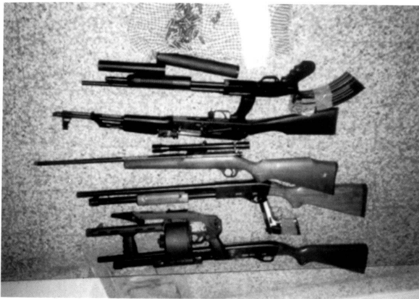
Découverte d'un trafic d'armes en faveur de l'UCK.

lité de capitale, abrite de nombreuses représentations diplomatiques.