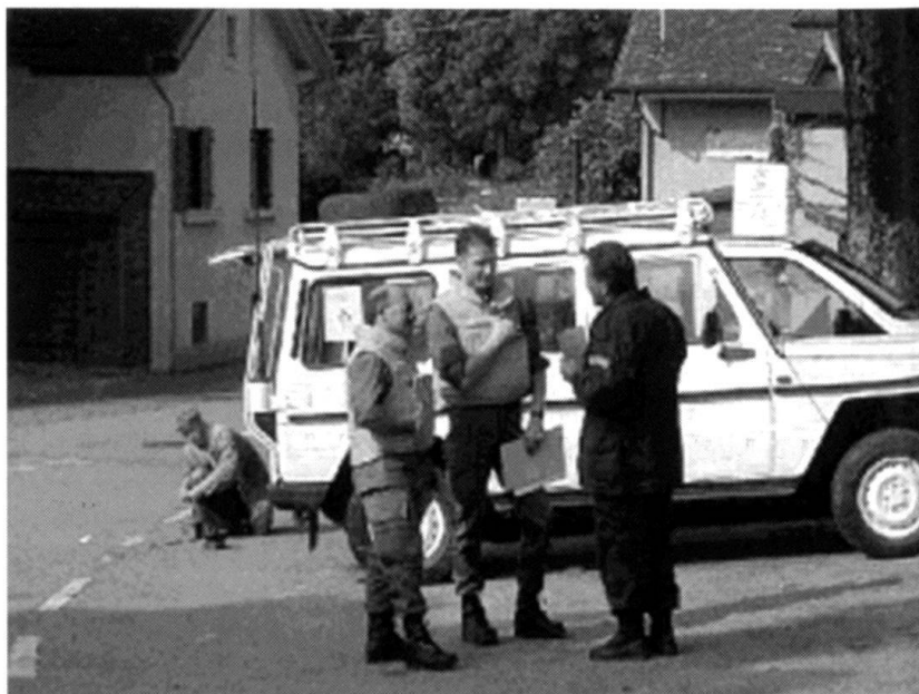
Une importance particulière est donnée à la protection des représentations diplomatiques et des organisations internationales (illustration: occupation du siège de l'OMC à Genève en 1999).

La protection des représentations diplomatiques et des organisations internationales revêt aussi une importance particulière dans ce contexte, surtout si l'on pense aux rôles tenus par Genève, où siègent plusieurs organisations internationales et qui accueille de nombreuses rencontres internationales, et par Berne qui, en qua-