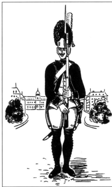
Grenadier du régiment de Courten. (D'après une gravure de la Bibliothèque nationale).

L'importance économique et l'attractivité du service étranger varient au cours des siècles; le développement des armes à feu de poing joue également un rôle important, faisant quadrupler les coûts de l'équipement d'une compagnie par rapport à ceux du XVI e siècle. L'intérêt constant des classes dirigeantes pour la conclusion de capitulations militaires avec les Etats étrangers, malgré le déclin de l'importance économique du service étranger, s'explique, entre autres, par le