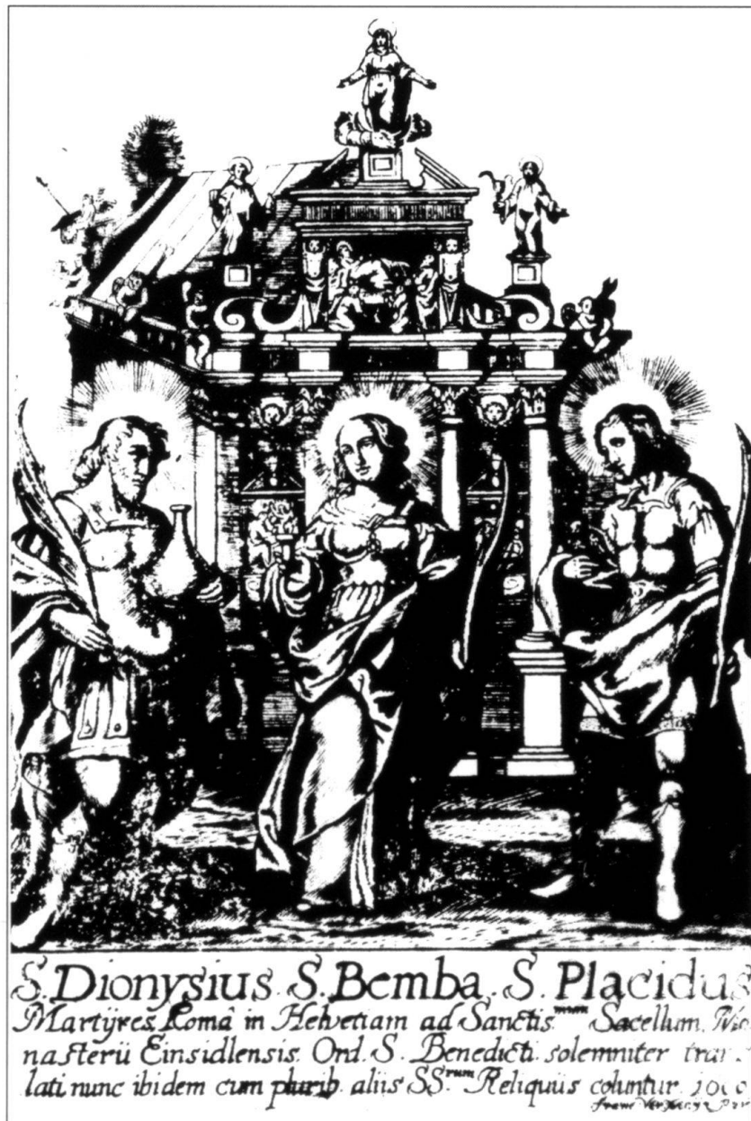
Des «saints de catacombe»...