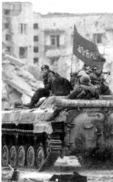
Transport de troupe russe à Grosny en 1999.

Depuis l'automne dernier, l'Etat russe tente de procéder à une «tchéchéenisation» du conflit, c'est-à-dire de remplacer ses troupes et ses fonctionnaires par des acteurs locaux. Afin de limiter l'impact de ses pertes sur l'opinion publique, le commandement interarmées a remplacé de nombreux conscrits par des soldats sous contrat. Mais l'engagement de troupes motivées avant tout par l'appât du gain a augmenté les pillages incontrôlés et aggravé la corruption, alors que la nomination de fonctionnaires tchéché-