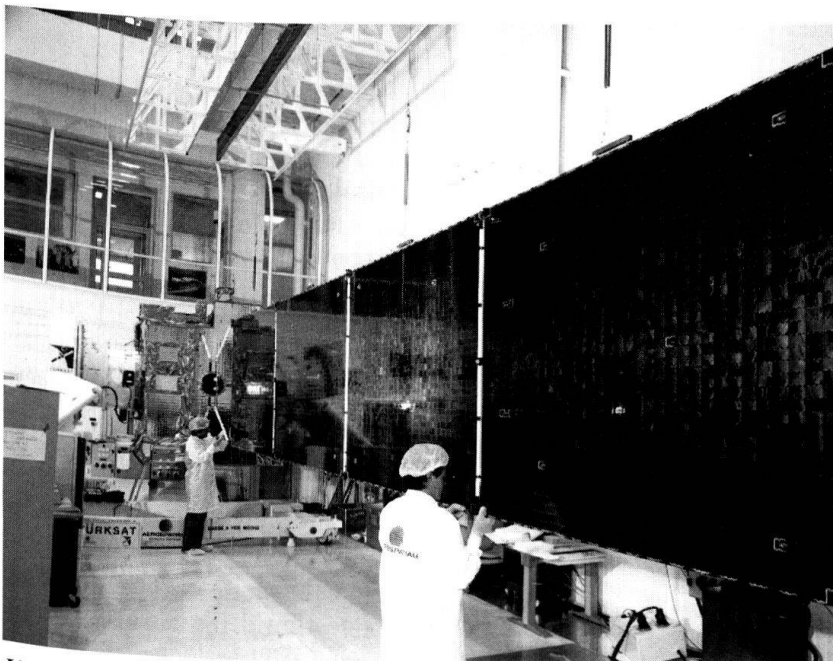
Un satellite européen, tous panneaux solaires déployés dans la «salle blanche» d'Aérospatiale.

La question des relations de l'UE avec l'OTAN et les Etats-Unis est encore une question centrale dans le développement de capacités européennes autonomes, ceci pour plusieurs raisons. En premier lieu, parce que 11 des 15 membres de l'UE sont aussi membres de l'OTAN, et, parmi eux, les trois puissances militaires européennes les plus importantes (Allemagne, France et Grande-Bretagne). Ensuite, parce que l'UE veut maintenant prendre des