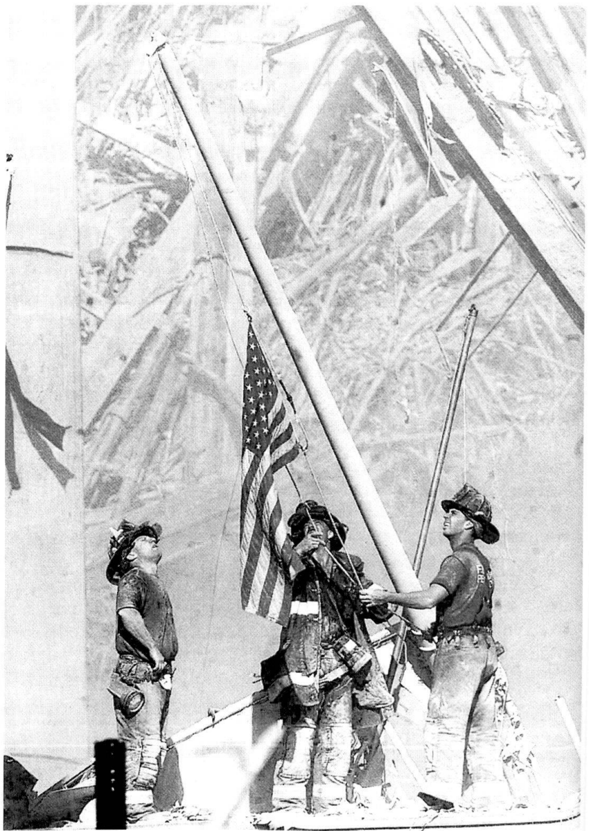
New York: sur le site des Tours jumelles, on hisse le drapeau américain.

On peut craindre l'enclenchement incontrôlable d'une mécanique de surenchère, dont les effets militaires et stratégiques pourraient peut-être être exponentiels («effet domino»). Si Washington se trompe de méthode et d'objectif, si les Américains ne savent pas peser les risques de dérapage politico-militaire, l'escalade folle est à craindre. En un quart de siècle, les Etats-Unis ont dramatiquement démontré leur profonde incompréhension d'un monde arabo-musulman aussi riche que complexe. Sous prétexte de lutter contre un extrémisme politique, n'ont-ils pas, eux-mêmes, mis en selle les plus fanatiques des fanatiques, des Ayatollahs aux Talibans? Et leur guerre du Golfe n'a-t-elle pas abouti à maintenir au pouvoir le «Satan