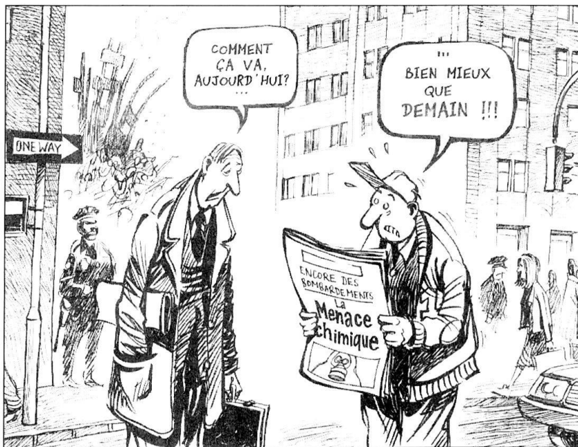
Le Temps, 10 octobre 2001.

évalués à leur juste niveau? Pourquoi n'a-on pas pris, avant le 11 septembre, les contre-mesures décidées depuis les attentats? Y a-t-il eu des fuites, des connivences, des complicités, une passivité calculée, une convergence d'intérêts criminels? L'hypothèse ne peut être balayée!