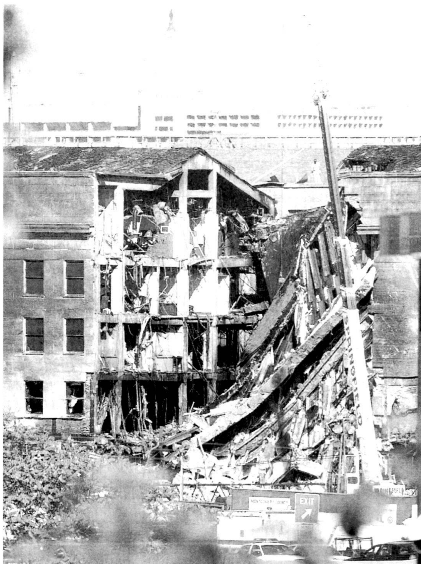
Une image qui illustre les dégâts au cœur de l'Amérique: au premier plan, l'aile du Pentagone qui s'est effondrée, et au fond, le Capitole où siège le Parlement américain à Washington. Les terroristes auraient encore voulu viser la Maison-Blanche et l'avion du président, l'Air Force One.

Tous les dirigeants arabes «modérés» (en fait des régimes autoritaires) vivent dans la terreur d'être balayés par une vague qui les emporterait. Dans un tel cas de figure, comment les Etats-Unis et l'Occident pourraient-ils contenir une poussée musulmane, organisée ou spontanée? Les Etats-Unis réussiraient-ils à coaliser leurs alliés européens dans une «introuvable armada» comme lors des désastreuses aventures moyen-orientales, africaines ou balkaniques des années 1990? Devant l'attitude officiellement alignée de l'OTAN, l'étrange enthousiasme de la Russie et de la Chine populaire, le flottement de l'Union Européenne et