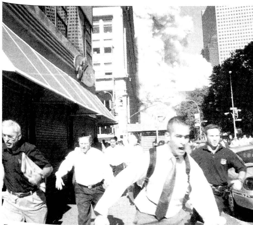
C'est la fuite effrénée alors que, tout près de là, l'une des deux tours du World Trade Center est en train de s'effondrer. Des scènes de guerre incroyables qui rappellent d'autres heures sombres vécues par les Etats-Unis: l'attaque surprise de Pearl Harbor, le 7 décembre 1944.

L'Amérique, surpuissante et omniprésente dans le monde, n'a pas d'ennemi extérieur.