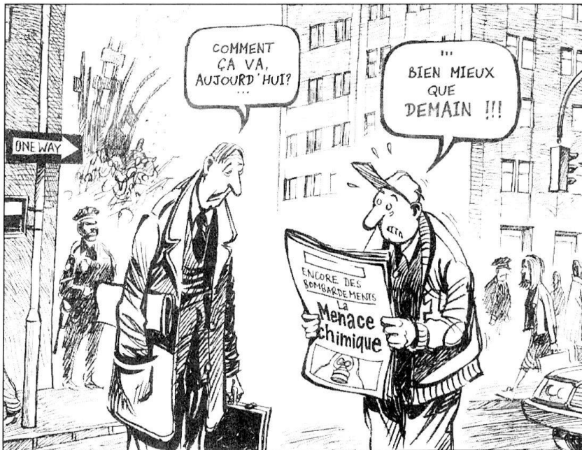
Le Temps, 10 octobre 2001.

évalués à leur juste niveau? Pourquoi n'a-on pas pris, avant le 11 septembre, les contre-mesures décidées depuis les attentats? Y a-t-il eu des fuites, des connivences, des complicités, une passivité calculée, une convergence d'intérêts criminels? L'hypothèse ne peut être balayée!