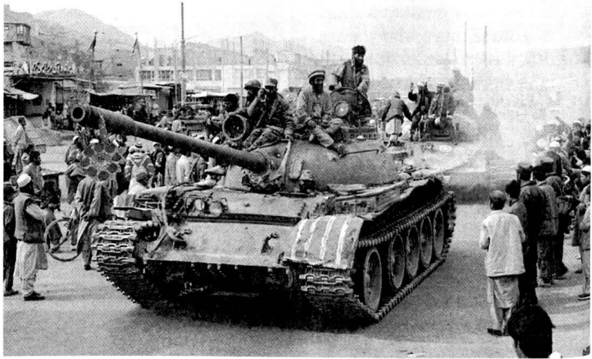
Les forces de l'Alliance du Nord lors de la prise de Kaboul.

Le terrorisme mortifère du 11 septembre devrait renforcer un partage des tâches entre Européens et Américains, dans les opérations de maintien de la paix et de stabilisation dans les Balkans, les premiers devant gérer leurs atterrages, alors que Washington se concentrera sur les défis globaux et mondiaux, en réduisant sa présence en Bosnie et au Kosovo. Certes, les déclarations européennes dans les débats relatifs au nouveau Concept stratégique de l'OTAN, en avril 1999, refusaient cette césure, au nom des intérêts globaux européens, mais la réalité stratégique pourrait imposer ce partage des mis-