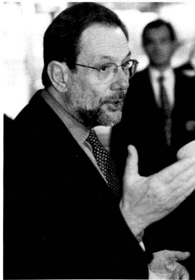
L'ancien secrétaire général de l'OTAN, Javier Solana.

Si des failles dans la solidarité transatlantique apparaissent en filigrane dans les débats politiques et intellectuels qui occupent le champ médiatique depuis l'après-11 septembre, les interrogations qui parsèmeront