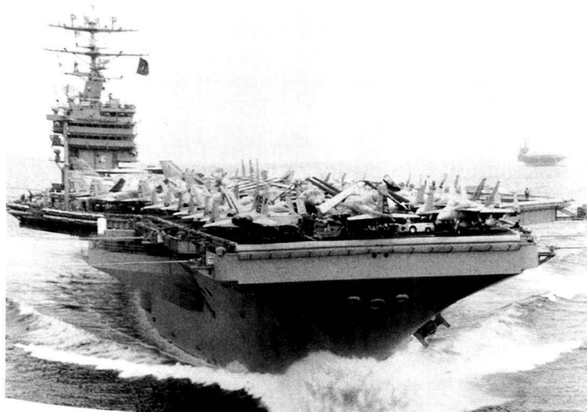
Le porte-avions George Washington.

L'Union européenne ne pourra longtemps éluder la question d'une clarification indispensable de la définition des missions dites de Petersberg, inscrites dès le Traité d'Amsterdam dans les missions de politique européenne de sécurité et