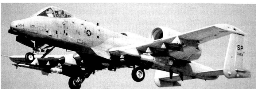
Le A-10 «tueur de chars».

Cela ne signifie pas la fin des attaques des forces armées ennemies au niveau opératif. Si les centres stratégiques se trouvent hors de portée des forces offensives, celles-ci seront obligées d'éliminer d'abord les défenses ennemies, pour atteindre ensuite ses centres de gravités opérationnels et stratégiques. Warden met l'accent sur l'anéantissement de la capacité décisionnelle. Sa théorie, en phase avec les évolutions technologiques regroupées dans le con-