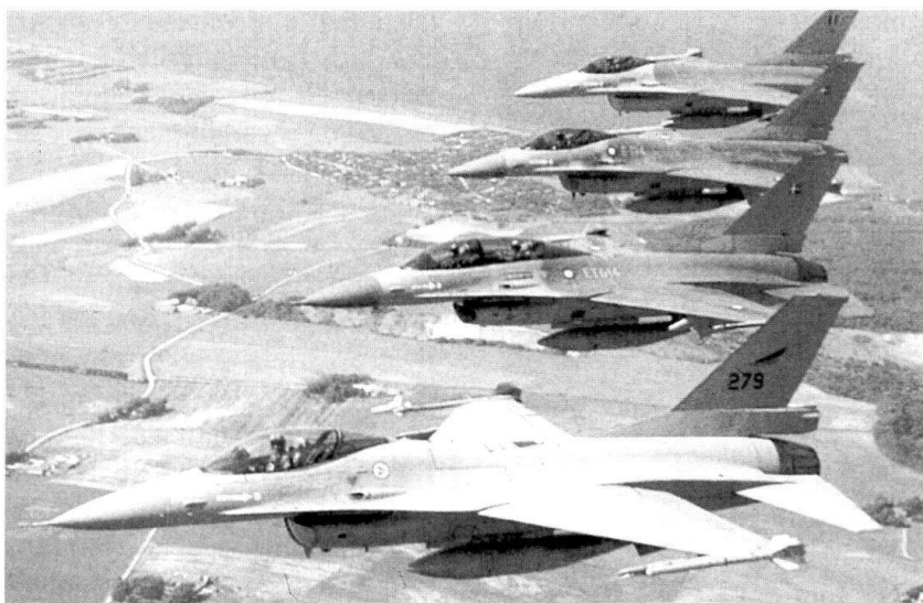
Les F-16 sont l'un des fleurons de la flotte européenne.

qu'il ne faut jamais descendre au niveau de la guerre de l'ennemi (niveau industriel). Le second, celui de l'intensité, voit dans la guerre de l'information une guerre qui ne doit connaître aucune limitation dans la montée aux extrêmes.