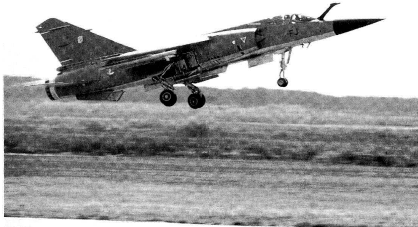
Le Mirage 2000D fait partie des avions engagés.

que les forces aériennes représenterait une option qui limiterait fortement le choix des chefs militaires dans leur quête de la victoire. Il fait remarquer que deux types d'armes peuvent interférer et bloquer le processus d'acquisition de la supériorité aérienne: ce sont les avions et les systèmes sol-air. L'infrastructure qui soutient ces systèmes d'armes ne doit pas être négligée, car elle est essentielle au bon fonctionnement de ces derniers. Elle comprend les systèmes de détection et de contre-mesures électroniques, les bureaux d'études ou d'ingénieurs qui élaborent les futurs systèmes d'armes, les munitions et le carburant des avions.