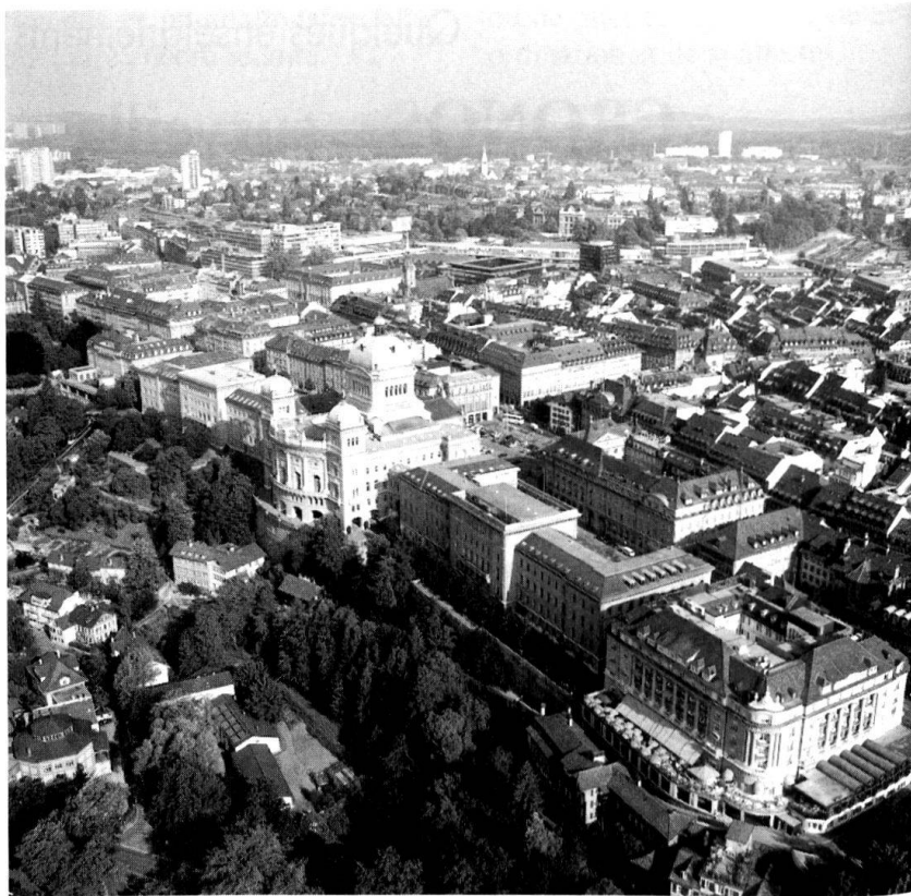
Vue aérienne de Berne avec le Palais fédéral.

Après que le Conseil fédéral a approuvé la demande des cantons de Genève et de Berne, il charge le Département de la défense de l'exécution. Prati-