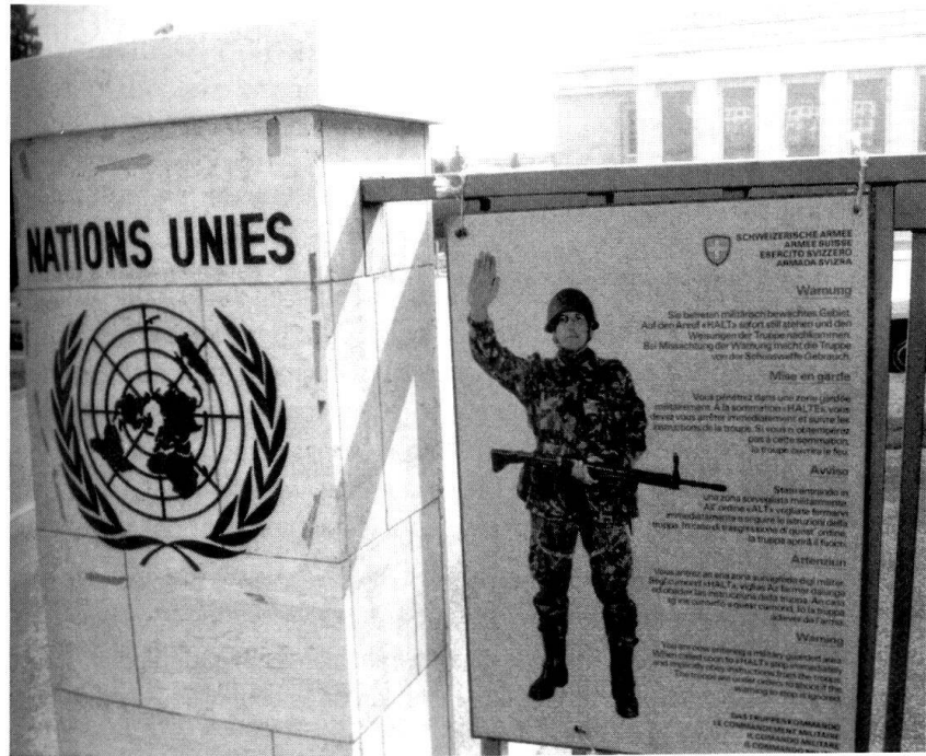
Des formes de collaboration nouvelles: service de garde à l'ONU, à Genève.

Les risques et dangers dans le domaine des Soft Security Issues (crime organisé, terrorisme, prolifération, environnement), qui attaquent la société aux défauts de sa cuirasse, s'ajoutent aux menaces militaires. Les attentats du 11 septembre en sont la démonstration. Dès lors, la sécurité doit être appréhendée