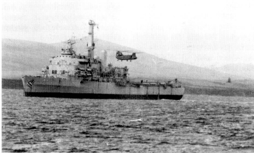
Un hélicoptère Chinook en train d'apponter sur le HMS Intrepid à l'ancre dans la baie de San Carlos, le 27 mai 1982.

Au sol, sans même évoquer le retrait des troupes d'élite et leur remplacement par des unités de conscrits mal équipées et insuffisamment entraînées, le commandement argentin multiplia les bévues. Au lieu de mi-