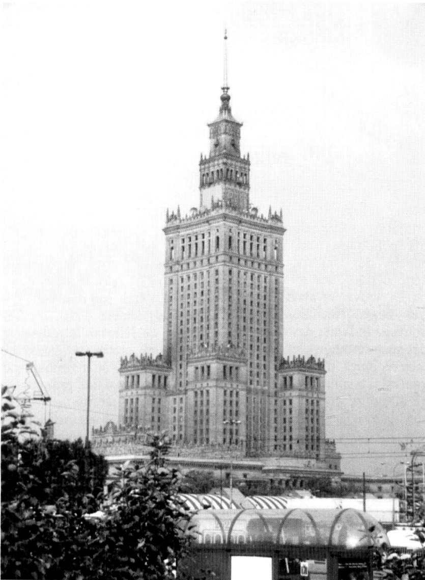
Varsovie : le stalinien Palais de la culture...

Le service militaire en Pologne communiste remplissait des fonctions politiques importantes et diversifiées. Les soldats qui l'accomplissaient servaient à défendre directement le système au pouvoir et à réaliser le programme de celui-ci. L'incorporation dans l'armée ou dans des formations paramilitaires était une forme de répression pratiquée contre les personnes classées par les autorités dans la catégorie des ennemis. L'endoctrinement politique quotidien avait pour but de légitimer le pouvoir communiste aux yeux des soldats. Pourtant, l'efficacité de ces procédés restait limitée, tandis que la résistance de recrues et des militaires suivait les protestations successives des Polonais contre un pouvoir qu'on leur avait imposé.