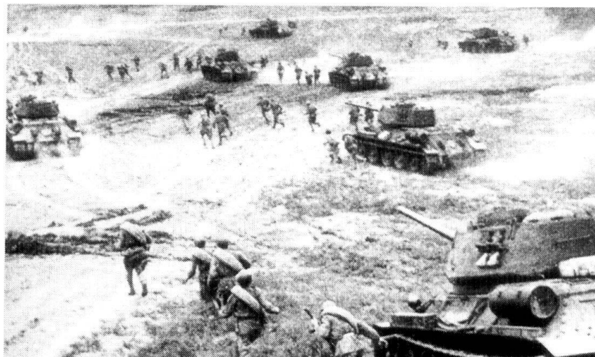
1944 : des troupes soviétiques s'approchent de Varsovie. Des libérateurs ou des occupants ?

On peut se demander si un tel endoctrinement a donné les résultats attendus et pendant combien de temps ? Difficile de répondre à cette question vu l'absence de recherches dignes