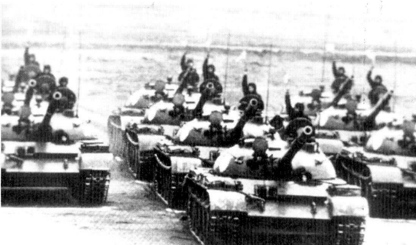
La présence de troupes soviétiques a marqué le destin de la Pologne depuis la fin de la Seconde Guerre mondiale.

Nous disposons d'informations relativement abondantes sur les bataillons de travail créés dès l'automne 1949, dans le cadre du service auxiliaire. Ils étaient destinés à ces recrues qui, suite aux recommandations de l'Office de sécurité, devaient accomplir le service militaire normal pour des raisons politiques ou de classe. Les recrues travaillent dans des conditions particulièrement pénibles, surtout dans les mines. En octobre 1956, les Corps militaires des mines comptaient plus de 35000 soldats. Pendant toute la durée de son fonctionnement, plusieurs centaines de décès ont été consignés.