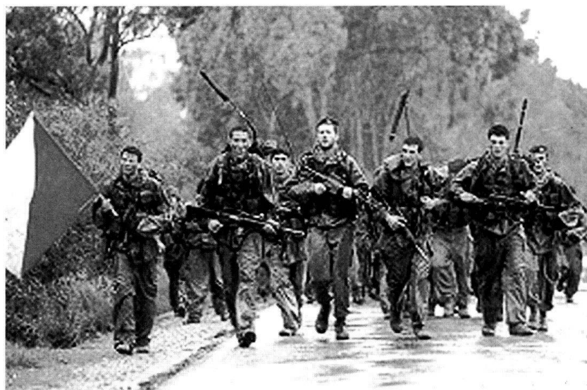
De jeunes Israéliens à l'instruction.

Les forces aériennes sont le moyen offensif mobile par excellence assurant la souveraineté de l'espace aérien; elles sont aidées par la défense anti-aérienne avec des armes à longue portée et des systèmes anti-missiles. La marine a pour mission de garder les côtes, de protéger l'espace sous-marin et de faire des reconnaissances de l'espace aérien.