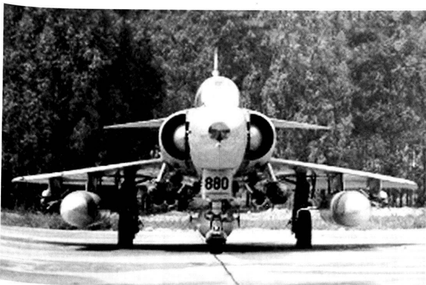
Un Mirage israélien.

Aujourd'hui, vu la prolifération d'armes chimiques et biologiques, la dissémination de l'arsenal atomique de ex-URSS