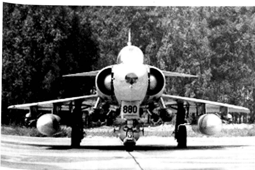
Un Mirage israélien.

Dès les années 1960, la volonté de dissuasion se réaffirme avec Ben Gourion qui fait développer l'arme nucléaire en tant qu'option dissuasive. Elle représente une puissance supplémentaire à n'utiliser qu'en cas de dernier recours. Il n'en reste pas moins que le développement d'armements conventionnels et l'avance technologique dans ce domaine restent les maîtres-mots de cette période.