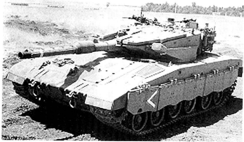
Le char de combat israélien : Le Merkava.

Les déséquilibres aux niveaux démographique, géographique et économique représentent trois dangers qui planent sur Israël. Ils se concrétisent par la crainte d'une coalition militaire des pays arabes environnants, qui pourraient mener des attaques à objectifs limités. Ces quinze dernières années, on a assisté à un renforcement considérable des puissances militaires au Moyen-Orient, ce qui, en Israël, fait craindre une attaque conventionnelle par surprise, alors que le terrorisme est également au centre de la menace. Si la menace classique date de la créa-