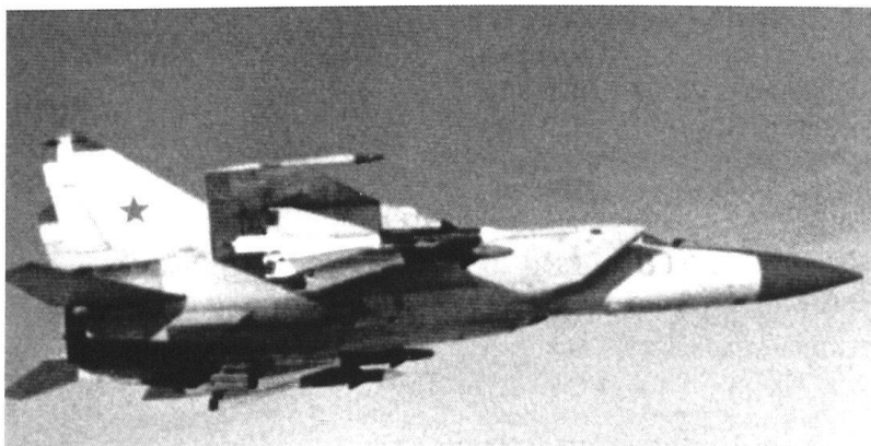
Le Mig-25 Foxbat , intercepteur soviétique à long rayon d'action.

Le rêve d'appareils sans pilotes a conduit à la réalisation de missiles de croisière ou balistiques, les V-1 et V-2 allemands faisant en la matière office de précurseurs. Alors que ceux-ci tendent à remplacer les bombardiers, d'autres missiles sol-air ou air-air remplacent de plus en plus les intercepteurs, conduisant à la création de chasseurs de «supériorité aérienne» capables de détruire un adversaire au-delà de l'horizon et d'interdire un espace aérien à tout intrus.