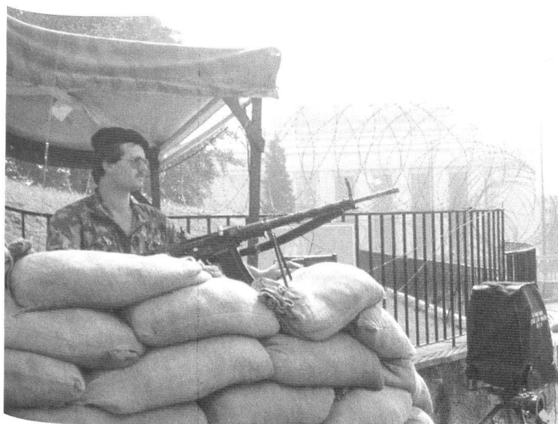
Une mission que l'on appelle «subsidaire» depuis l'Armée 95: la garde des bâtiments de l'ONU à Genève et des missions diplomatiques à Genève, Berne et Zurich.

Pour faire mieux comprendre comment ce problème a évolué et ce qu'il est devenu aujourd'hui, nous devons faire appel à un souvenir personnel. Il date du 6 octobre 1973. Nous étions à cette époque chef du Service de renseignements extérieurs. Ce 6 octobre, notre pays, comme le reste du monde, vit dans la plus grande quiétude. A 14 h. les forces égyptiennes forcent le canal de Suez. La surprise est totale (enfin presque). La guerre se déchaîne. A 17 h le même jour, le Service de renseignements apprend que les forces américaines et soviétiques d'Europe sont mises en état d'alerte. Et les divisions qui se font face sur le Rideau de fer, à 250 kilomètres de