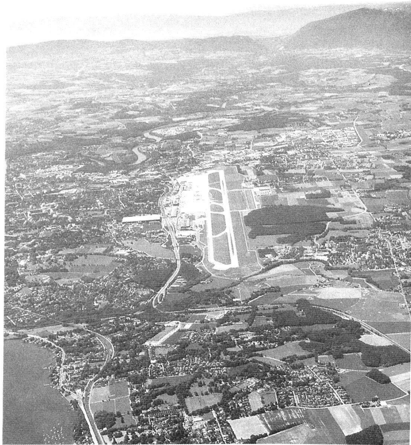
Une infrastructure «sensible» dans le secteur du CA camp 1: l'aéroport de Genève-Cointrin.

Foisonnant d'informations diverses, Le temps des mutations est aussi un bel ouvrage, en raison de la qualité de son graphisme et de ses illustrations