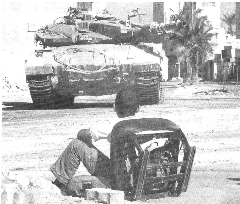
Ce très jeune Palestinien sait pertinemment que ce Merkava israélien ne lui roulera pas dessus.