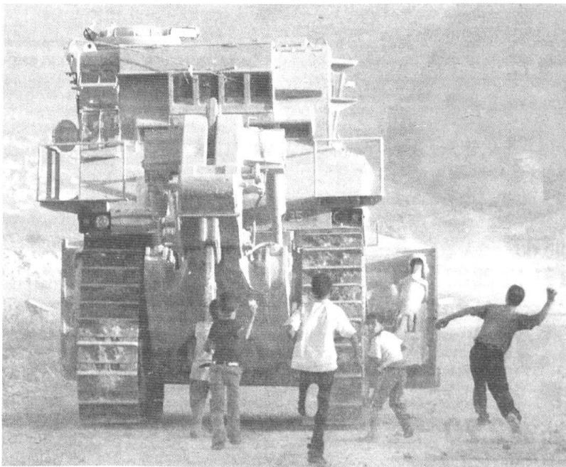
Un trax blindé israélien face à de très jeunes lanceurs de pierres.

Cette tendance générale s'accompagne de fortes différences selon les nations et les régions - donnons-en un seul exemple particulièrement critique. Tous les pays du pourtour méditerranéen sont entrés dans la transition démographique, avec un taux de natalité proche de l'effondrement pour les pays d'Europe méridionale (seuls les pays de l'ex-Yougoslavie restent au-dessus de 10‰, moins accentuée pour les pays de la rive africaine (de 17 à 27‰) et adriatique: Turquie (22‰), Syrie (31‰), Israël (21‰). Un seul groupe échappe à cette tendance, les Palestiniens, avec un taux de natalité de 40‰. L'écart entre Israéliens et Palestiniens est encore plus net si l'on prend l'indice synthétique de fécondité: 2,9 pour Israël. 5,9 pour les territoires palestiniens. Au rythme actuel, la population palestinienne aura doublée en 2025 (7,4 millions contre 3,5 en 2002), alors que la population israélienne n'aura augmenté que de moitié (9,3 millions contre 6,6).