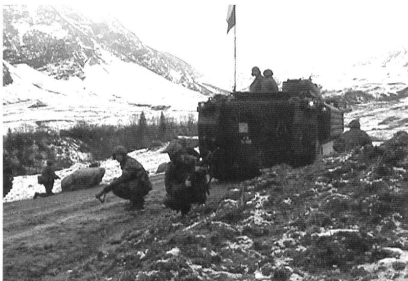
Des grenadiers de chars débarqués.

Le «déséquilibre» 3: 1 entre chars et grenadiers de chars ne pourra se régler que par la mise en service d'une seconde tranche de CV-9030 . Fidèles à la devise «Moins mais mieux», les grenadiers disposeront désormais d'une panoplie d'armes moins étendue. Il est vrai qu'il est difficile d'imaginer qu'un jeune chef de section engage simultanément et de façon optimale des fusils, des fusils à lunette, des lance-grenades, des canons 20 mm, des Panzerfaust , des Dragon , des mines antichars, des tubes et des moyens explosifs. L'introduc-