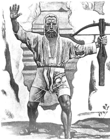
Utilisation du mythe «Guillaume Tell»...

propre justification et dont l'enseignement est dans tous les cas nécessaire, au même titre que la langue nationale, les mathématiques, la biologie, la musique, le chant, la gymnastique. Avec la généralisation de l'instruction publique au XIX e siècle, une formation, qui jusqu' alors était réservée aux élites, est étendue progressivement à la population entière. La transmission des savoirs acquiert ainsi une importance croissante pour la classe politique. Les enseignements dispensés sous la direction des ministères de l'éducation dans les domaines de la géographie et de l'histoire ont tous évolué de manière spectaculaire au XX e siècle.