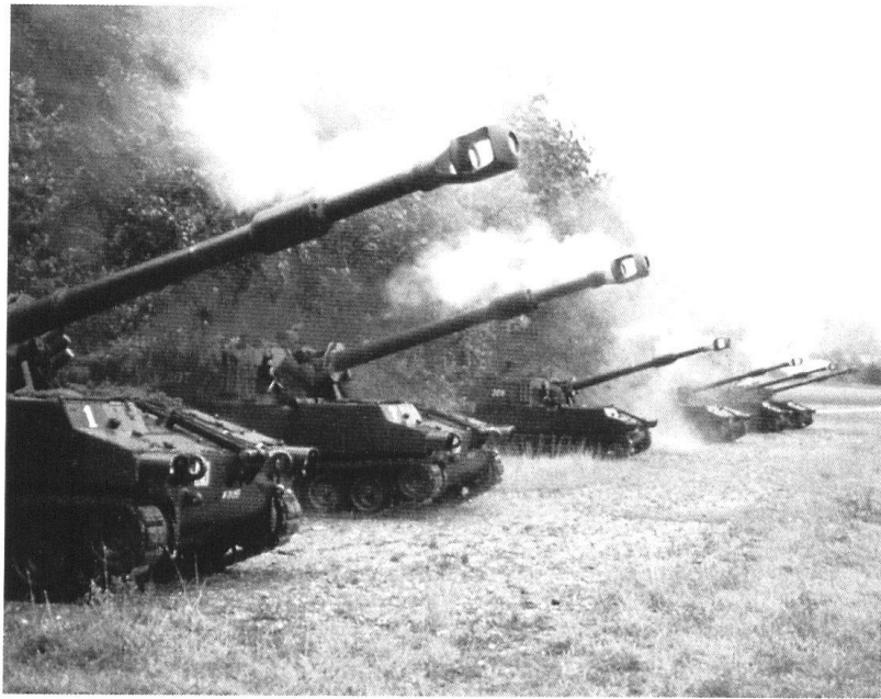
Une batterie de M-109 en position de feu.

Avec la fin de la guerre froide et la période de détente qui l'a suivie, on a pu douter de la nécessité et de l'existence de brigades blindées dans notre pays. Cette appréciation à court terme est remise en cause par l'incertitude sécuritaire d'aujourd'hui et les développements aux portes du continent européen. L'existence de brigades blindées et leur état de préparation contribuent à la crédibilité de la politique de sécurité de la Suisse. Comme formation à l'exercice ou à l'instruction, elles ont une influence positive sur le maintien de la paix et elles contribuent à la stabilité au centre de l'Europe. Enfin elles représentent l'assurance que notre pays et sa population peuvent déterminer li-