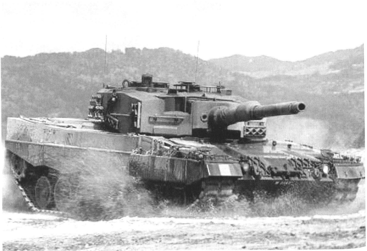
Un Leopard en pleine action.

des services devraient grandement contribuer à ce but. Si l'instruction sur simulateur reste un outil de travail économique et performant, il faut pourtant effectuer régulière-