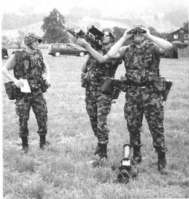
Une équipe Stinger.

des services devraient grandement contribuer à ce but. Si l'instruction sur simulateur reste un outil de travail économique et performant, il faut pourtant effectuer régulière-