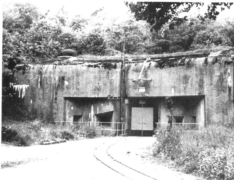
Entrée « Munitions » de l'ouvrage de Rochonvillers.

Ensuite parce que des forts comme celui du Pas-du-Roc ,