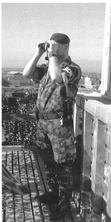
La garde fait aussi partie des missions de la section.

Le passage rapide d'un état de préparation «jaune» à «rouge», l'exercice de missions de sécurité au sein d'une population civile pas forcément hostile mais qui représente toujours des risques... Rien de neuf pour un policier, mais beaucoup d'éléments à maîtriser