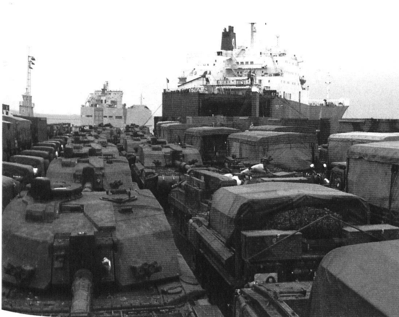
Une partie des véhicules de la 7 e brigade blindée britannique («les Rats du désert») chargés à Emden (D).

Cette appréciation s'est appliquée à deux domaines, alors que les Anglo-Américains ont déployé plusieurs centaines de systèmes d'armes, allant du fusil d'assaut au missile Tomahawk . Une division comme la fameuse 3 e division d'infanterie mécanisée, le fer de lance de l'offensive terrestre américaine, aligne quelque 650 véhicules à chenilles, sans compter les véhicules à roues (les énormes jeeps Hummer , les camions-citernes, les camions de transport, etc.).