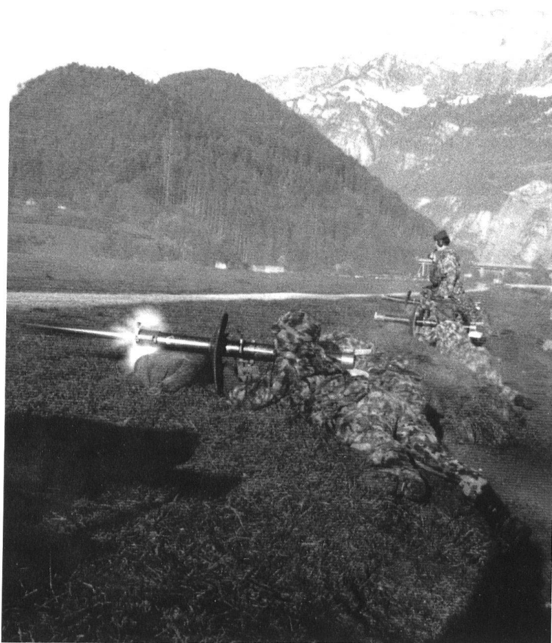
Tir au tube roquette.

En 1944, comme en 1940, la menace sur le front Nord-Ouest touche directement la ville de Bâle et l'Ajoie. Refusant de s'y laisser aspirer dans un engagement qui serait préjudiciable à la défense générale du pays, Guisan est résolu à riposter à toute attaque par des mesures immédiates et efficaces. A cet effet, les brigades légères 1 et 2 sont relevées en Ajoie par la 2 e division. En obligeant le commandement suisse à rappeler, simultanément ou successivement, sous les armes ses Grandes Unités, et à en engager le plus grand nombre, la campagne de 1944-1945 permet de vérifier que la troupe n'a pas perdu de son efficacité dans le Réduit.