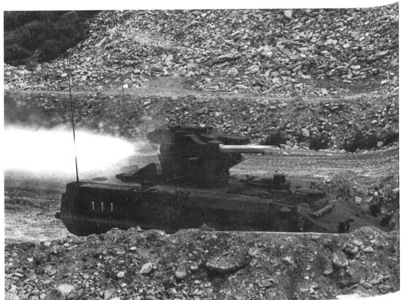
Le chasseur de chars Piranha.

tour de rôle: par exemple une brigade de landwehr avec un régiment d'infanterie d'élite.