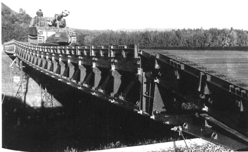
Un obusier blindé sur un pont fixe 69.

plusieurs victimes en 1975. Un nouvel équipement d'hiver venait pourtant d'être distribué avec du matériel supplémentaire destiné en priorité aux troupes de montagne. L'initiation à la pratique du ski, l'instruction antichar, le travail de nuit, l'instruction au service de garde, le tir, les relations plus personnelles qui s'établissent dans des conditions difficiles confèrent aux cours d'hiver de la division frontière 2 un caractère particulier.