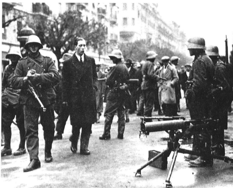
Dans un service d'ordre, la mitrailleuse, bien en évidence, doit avoir un effet dissuasif... Elle n'est pas engagée. A Genève, un fusil mitrailleur a tiré.

Beaucoup de manières donc de percevoir le 9 novembre 1932 au cours de ces trente années. Cependant, afin d'obtenir une vision globale et totale de cet événement pendant cette période, il convient de l'étudier sous divers angles thématiques.