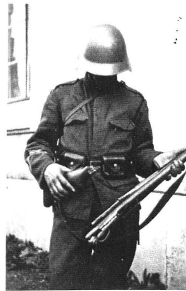
Le 9 novembre, des manifestants ont pris à des recrues des armes et des équipements et les ont mis hors d'usage...

elles ne doivent certainement pas lui valoir d'être tenu pour l'unique responsable de ce drame.