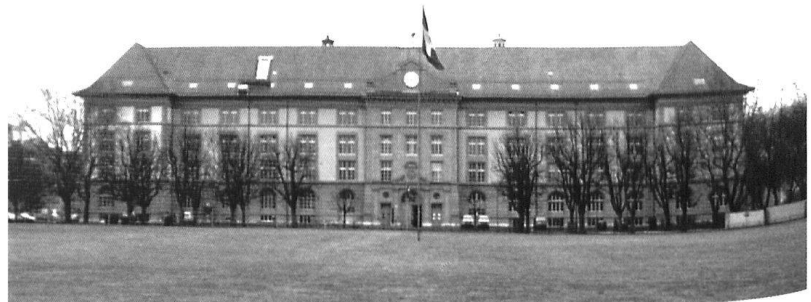
Die Kaserne Bern.

Im Innern der Kaserne, welche im übrigen von der Mezerkaserne in Mannschaftska-