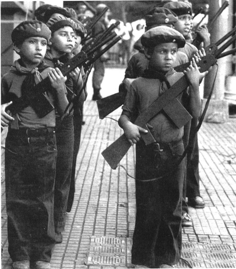
Enfants au Nicaragua : s'exercer à la guerre.

En effet, les acteurs non étatiques n'ont pas une meilleure compréhension des conflits modernes : des connaissances périssables et relatives, issues de l'expérience, ne constituent pas, à elles seules, une doctrine digne de ce nom. Malgré toute la rhétorique sur la guerre révolutionnaire en vogue dans les années 50 et 60, les guérillas atteignent rarement leurs objectifs stratégiques ; aujourd'hui, elles sont des organisations plus criminelles que politiques. Furieusement à la mode dans les années 70 et 80, le terrorisme