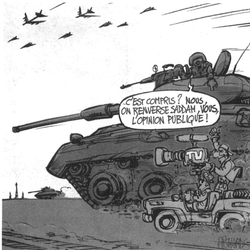
Guerre des images : les médias sont en premières lignes. Vu par Richards. (Coopération, 26 mars 2003).

L'évaluation des possibilités d'actions adverses est un élément central de toute planification. Traditionnellement, le renseignement militaire se concentre sur les moyens disponibles en personnel et en matériel pour en déduire les capacités des forces opposées; l'intention de leurs chefs est prudemment délaissée, en vertu du principe qu'il est plus simple – donc bien plus probable – de changer d'intention qu'obtenir des capacités différentes. Face à des formations armées régulières, organisées en fonction d'une mission, unifiées par une doctrine homogène, cherchant à atteindre les buts stratégiques fixés par l'échelon supérieur et astreintes aux lois de la guerre, cette méthode a fait ses preuves. Le nombre d'actions susceptibles d'être entreprises par une brigade mécanisée, une escadrille de chasseurs-bombardiers ou une frégate lance-missiles reste limité. Les performances de leurs équipements peuvent être quantifiées dans l'espace et dans le temps, numérisées avec précision et utilisées dans une simulation infor-