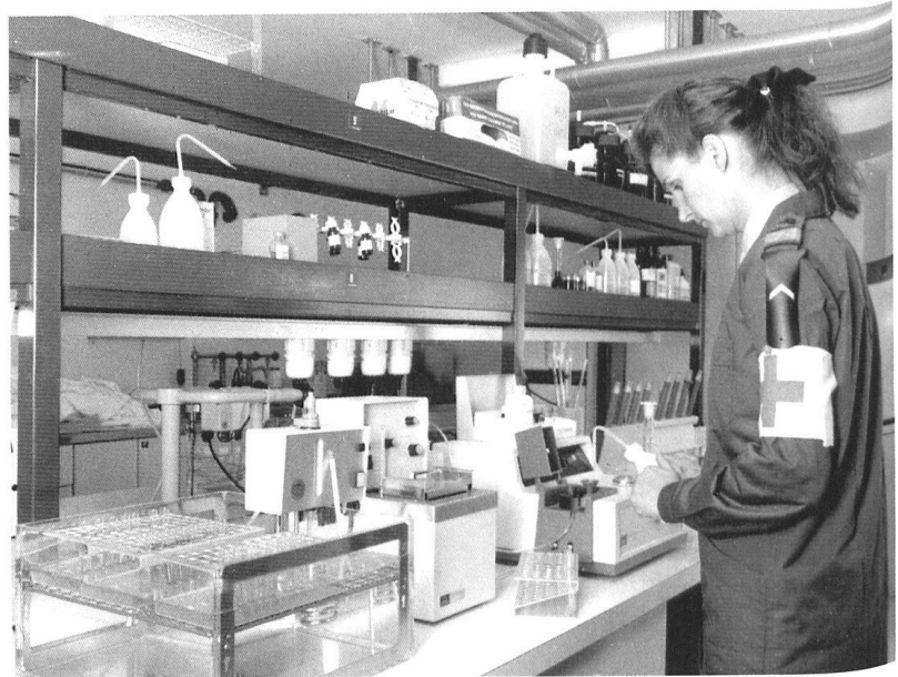
Vue d'un laboratoire de l'armée.

La tête de réseau du projet ASIMC, comme le secrétariat du service sanitaire coordonné (SSC), dépend administrativement du Médecin en chef de l'armée. Ses structures comprennent un Conseil de direction avec un Conseil scientifique, un Décanat et, pour l'instant, cinq centres spécialisés en médecine militaire et de catastrophe, rattachés aux cinq fa-