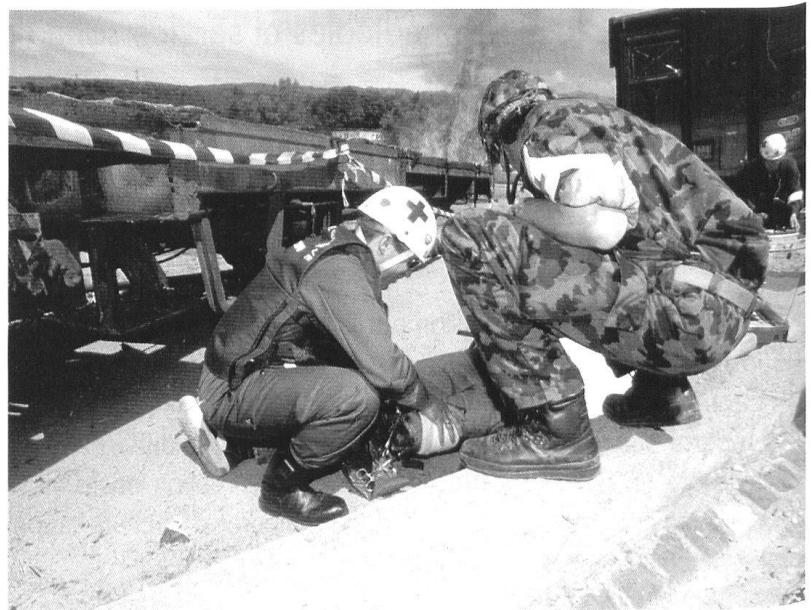
Exercice franco-suisse «LÉMAN 99»: une intervention sanitaire binationale.

La Commission recommande d'intéresser déjà les candidats à une profession de la santé à une double carrière, civile et militaire, grâce notamment au