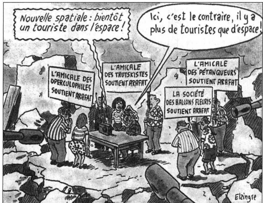
Des haines inextinguibles malgré les manifestations des « gentils ». (L'Express, 25.4.2002).

Si le futur ne recèle qu'un nombre restreint de modes opératoires authentiquement nouveaux, leur addition et leur synchronisation atteindront un degré jusqu'ici inconnu ou ignoré. Les attaques que nous subirons seront une combinai-