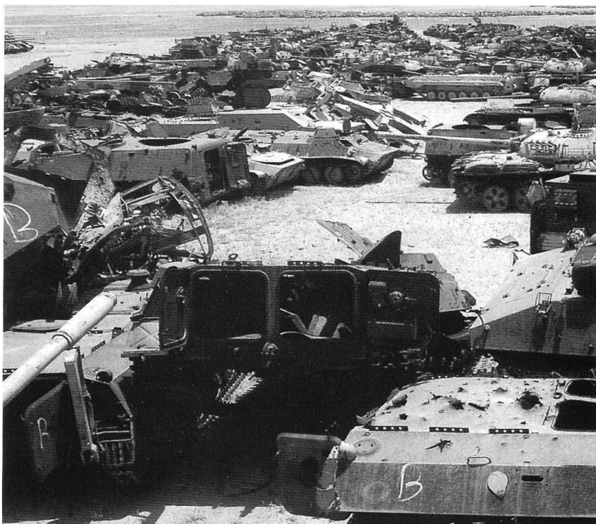
Les mesures de désarmement n'impliquent pas forcément un futur «apaisé»...

Imaginer aujourd'hui que nous puissions demain être délibérément, directement ou personnellement attaqués est inconcevable aux yeux de nombreux dirigeants européens. Cela ne correspond pas à l'image qu'ils se font du monde, de la paix perpétuelle que l'élargissement de l'Union européenne doit rendre inéluctable. En Suisse plus encore que dans le reste du continent, l'idée de guerre est rejetée comme une horreur inconcevable et une absurdité révolue; le fait que la presque