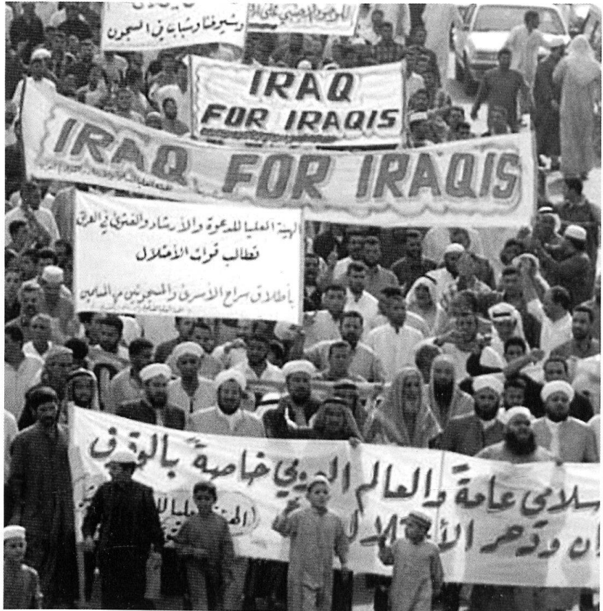
Manifestation en Irak...

Toute pacification semble reposer sur trois facteurs au moins :