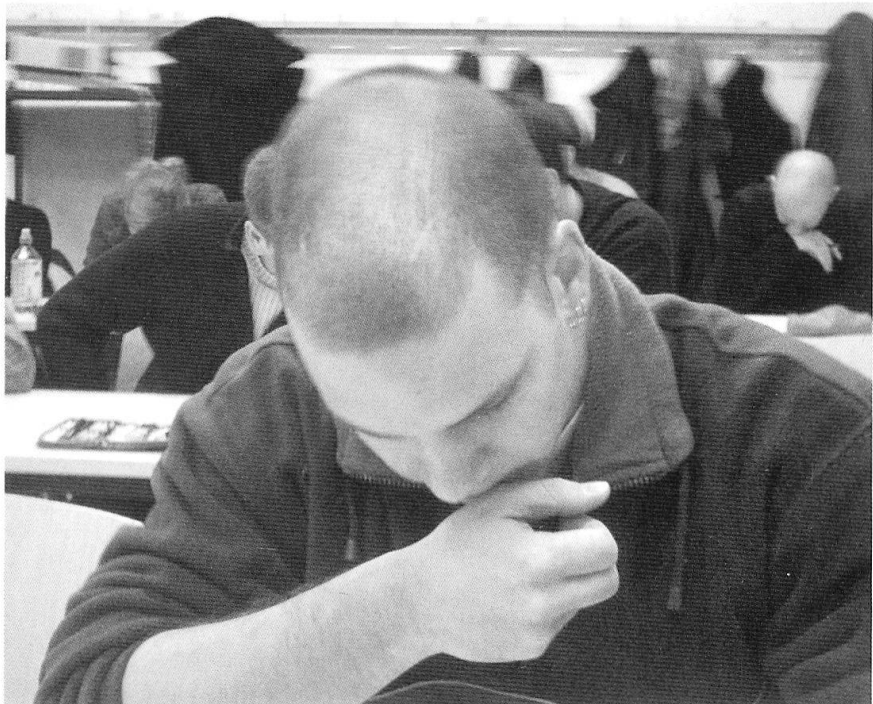
Travail assidu à l'Ecole polytechnique fédérale de Zurich.

Le stage de formation «Diplôme» est la filière qui permet aux étudiants disposant d'un