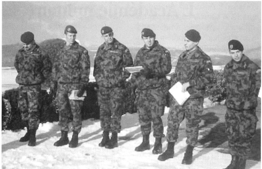
Instruction dans le terrain.

– un corps enseignant hautement qualifié et reconnu internationalement ;