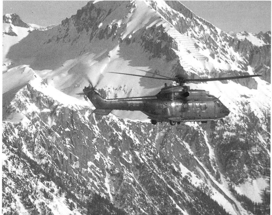
Reconnaissance en Super-Puma.

Le Stage de formation supplémentaire 2 prépare pendant huit semaines les futurs commandants d'école, commandants de stage de formation et autres cadres supérieurs de