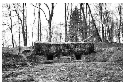
Embrasures de tir pour mitrailleuses.

Plan Châtel. Commençons la visite au point culminant du Mont Vully, à 653 mètres d'altitude. Un panneau donne des informations sur le secteur-clé de Morat au cours des deux derniers millénaires, également sur son importance pendant les deux guerres mondiales. On peut trouver des renseignements sur les postes de commandement qui ont été construits en 1914. Les casemates, les postes d'observation d'artillerie et les passages souterrains peuvent être visités.